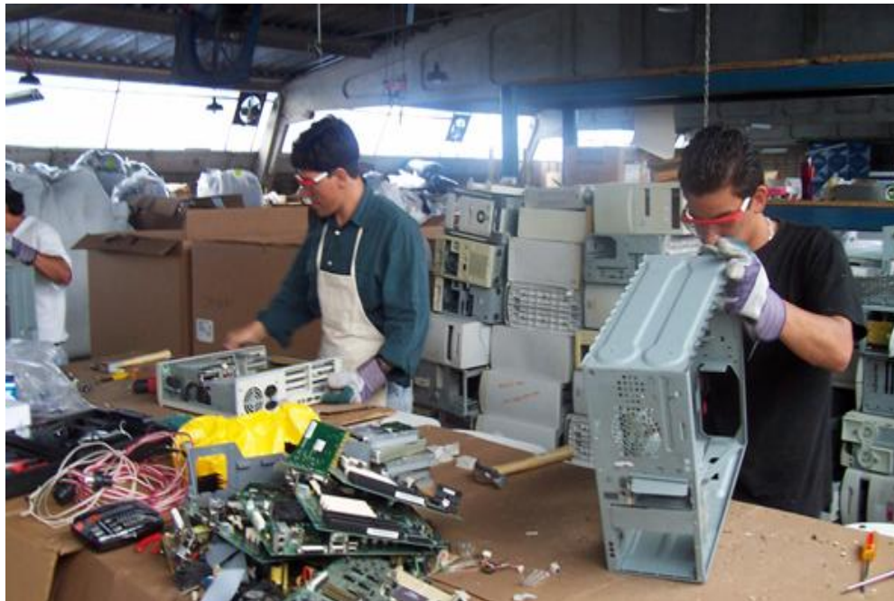
Figura 6 Proceso de desensamblaje de computadoras en el Centro de Transferencia y Transformación de Materiales.

Se tuvo la oportunidad de comentar a los participantes durante el segundo semestre del 2005, sobre el plan piloto para el desensamblaje de 1000 computadoras obsoletas del Instituto Tecnológico de Costa Rica, se comentó que el objetivo era evaluar los costos operativos y el envío de los desechos peligrosos al exterior, en la figura 6 se muestra el proceso.