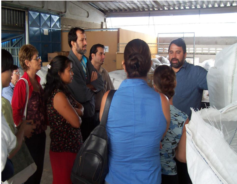
Figura 2. Recorrido de los participantes por el aula demostrativa ubicada en las instalaciones del Centro de Transferencia y transformación de materiales (CTTM).

3. El día de la visita del grupo interesado, primero se les daba un recorrido por cada una de las partes de operación del CTTM (recolección, descarga, clasificación, compactación, molienda, almacenamiento, inventario y salidas de material) como se muestra en la figura 2.