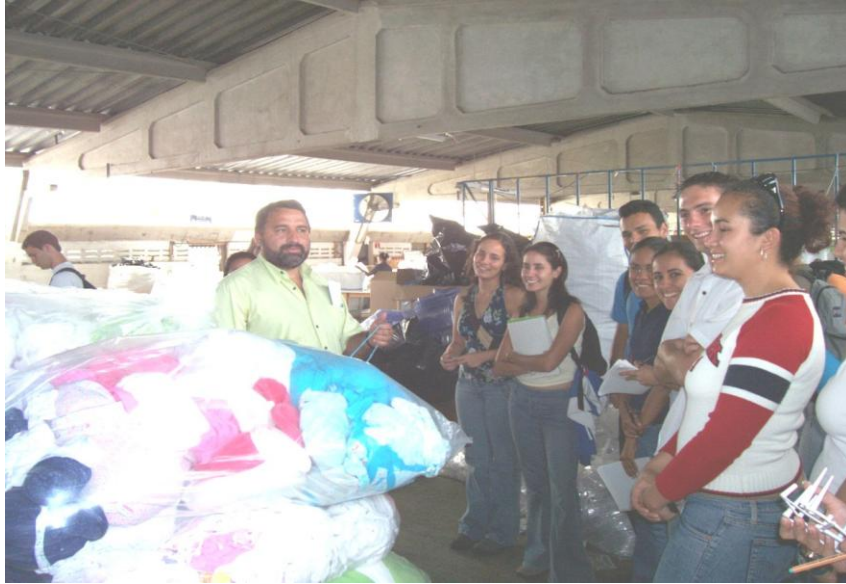
Figura 8 Grupos de estudiantes de Ingeniería en Materiales en el CTTM.

Se propiciaron visitas a las instalaciones del CTTM de los posibles clientes, proporcionándoles muestras de los materiales recuperados para evaluar la incorporación de éstos en sus procesos.