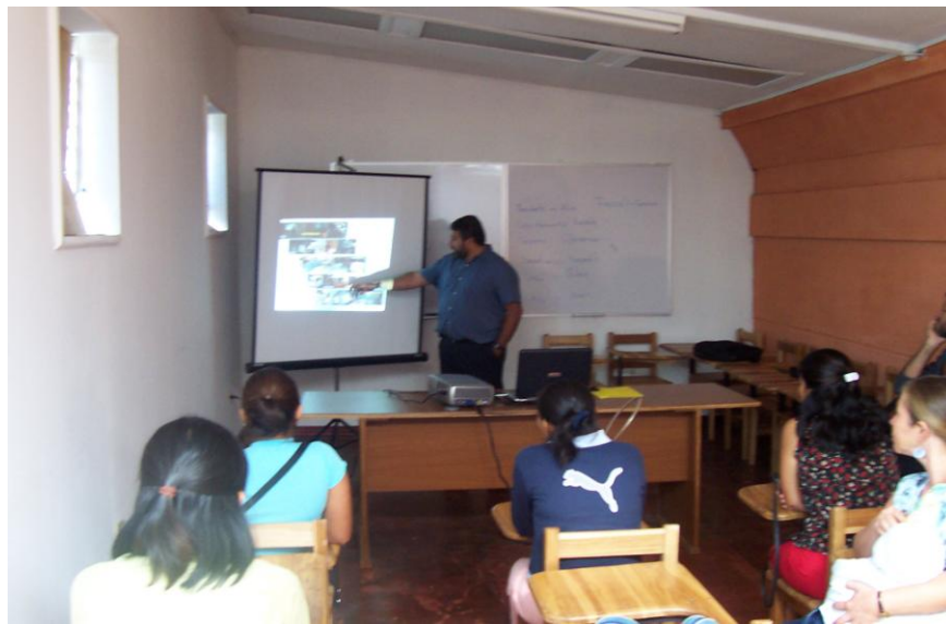
Figura 1. Fotografía de la sala de capacitación del Centro de Transferencia y Transformación de Materiales.