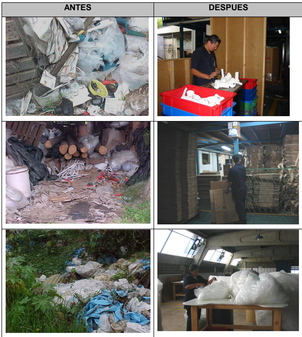
Figura 5. Comparación del manejo anterior y actual de los desechos recuperados del Parque Industrial de Cartago