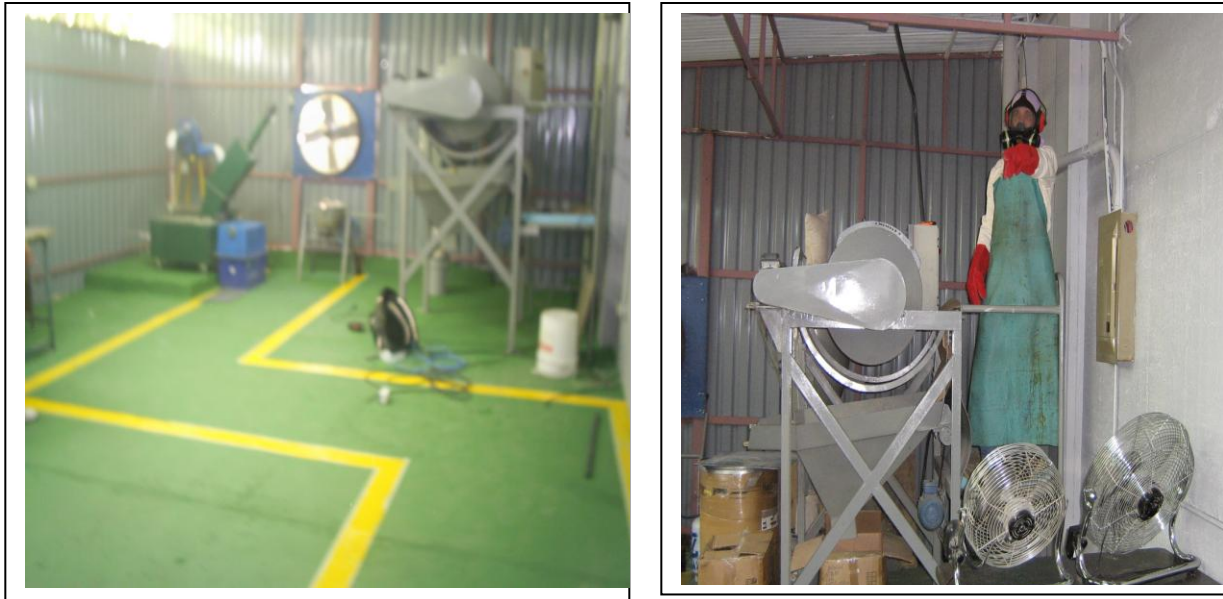
Figura 7 Fotografía del proceso de inertización de mercurio de los bombillos y tubos fluorescente.

En las instalaciones del CTTM, también se cuenta con un proceso de inertización del mercurio de los bombillos y tubos fluorescente (figura 7), el cual también fue parte de de las demostraciones, específicamente en el área de desechos peligrosos.