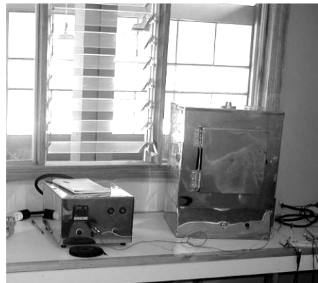
Ilustración 2: Horno de temperatura intermedia (derecha) y control portátil de temperatura de uso general (izquierda).