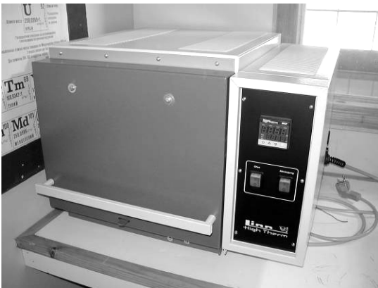
Ilustración 1: Horno de alta temperatura