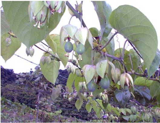
Plantación de granadilla

Las primeras plantas madres fueron seleccionadas en las fincas de productores, ubicadas en la Sierra y el Congo de Santa María de Dota, sin embargo las plantas se encontraban en período de floración y fructificación. Esta condición no es la óptima para iniciar un proceso de obtención de estacas y brotes, ya que la planta tiene detenido el crecimiento vegetativo.