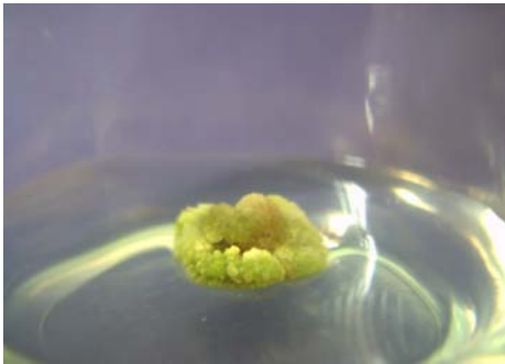
Meristemo de granadilla

En ambas introducciones se logró disminuir los porcentajes de contaminación fungosa y bacteriana, además se obtuvo un alto porcentaje de sobrevivencia de los meristemas, sin embargo la mayoría formó un callo y no se diferenció.