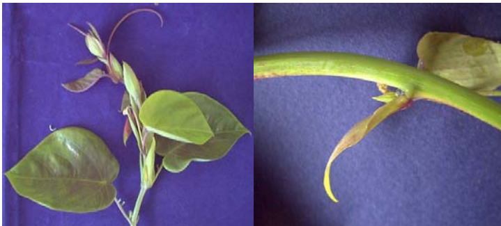
Eje de granadilla con yemas

Se colectaron ejes de las plantas y se trasladaron al laboratorio. Posteriormente se seccionó el eje en trozos de aproximadamente 15mm que presentaran una yema, se sometieron a un proceso de desinfección.