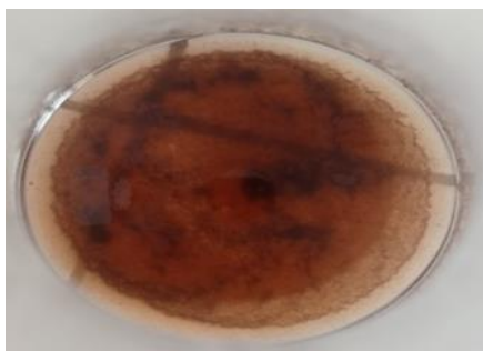
Gambar 1. Endapan lignin yang terbentuk