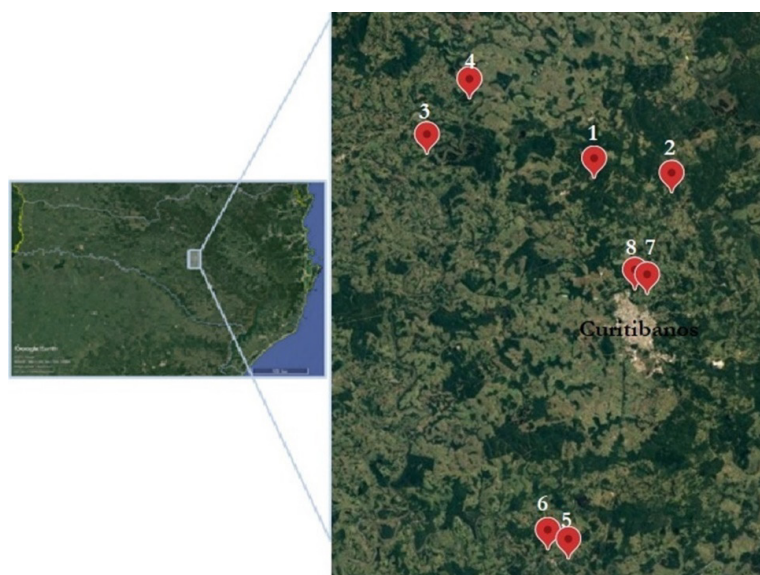
Figura 1 - Pontos de amostragem de água em Curitibanos, SC.