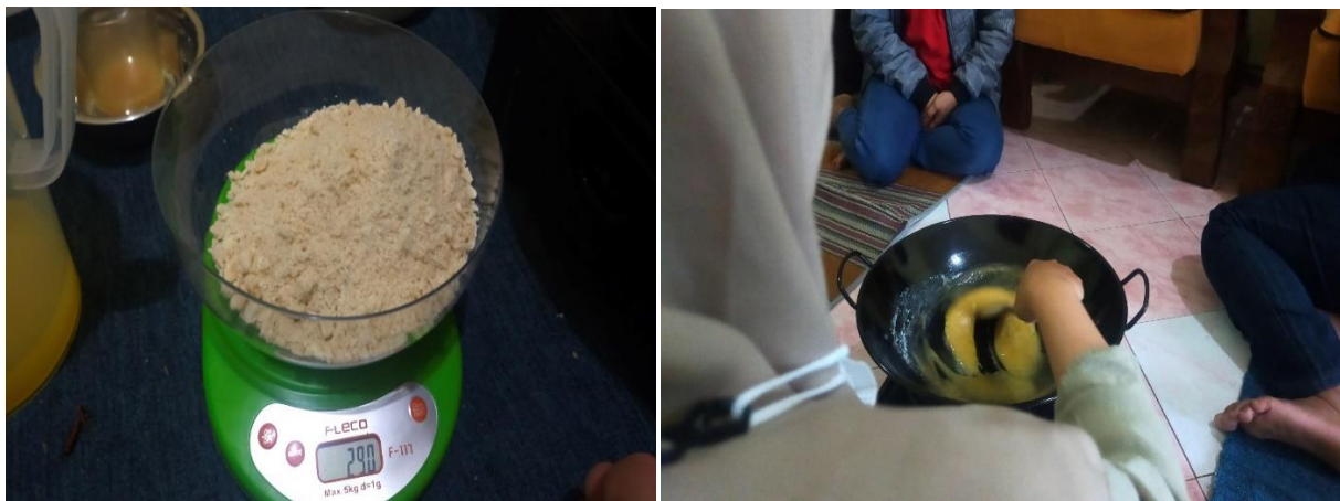
Gambar 1. Pelatihan Dan Pengembangan Resep Produk Minuman Jeruk Instan

Kemudian untuk tahap ketiga dimulai pada bulan Mei, Juni dan Juli 2023. Di mana setiap bulan akan dipraktikkan pembuatan dengan resep yang berbeda. Dalam pelaksanaan praktik ini dilakukan secara pemaparan lisan dan dilanjutkan dengan praktik oleh kelompok PKK Desa Kucur. Kelompok PKK Desa Kucur dibagi menjadi 2 kelompok dan tiap kelompok mendapatkan alat-alat dan bahan yang dibutuhkan untuk pembuatan minuman serbuk instan dari jeruk tersebut. Alat-alat yang digunakan dalam praktik ini diantaranya adalah gelas ukur, wajan, spatula, dan sendok takar, baskom, alat peras jeruk dan lain-lain. Nilai uji hedonik dari ketiga resep dilakukan pada 16 orang perwakilan kelompok PKK Desa Kucur dapat dilihat pada grafik dibawah ini, setiap aspek seperti warna, tekstur, aroma, kelarutan dan rasa ditampilkan pada grafik tersendiri.