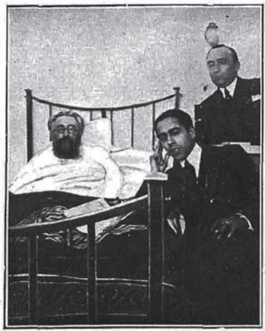
Don Ramón del Valle Inclán en el Hospital de Santiago