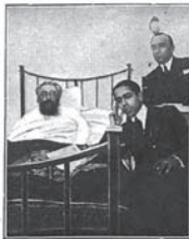
Don Ramón del Valle Inclán en el Hospital de Santiago

Don Ramón María del Valle Inclán ha estado internado en un sanatorio, tiene un aspecto de superhombre. El león de pelo entrecisado tiene una cabeza imponente que dan a la cabeza aspecto de trago. Demasiado imponente incluso a D. Ramón con su cabeza delirante en el lecho. Tiene barbas fornidas y desliado un pelo negro, en que lucha lo blanco en agria lucha. Tiene en la vejez del escritor un aspecto de un león de pelo entrecisado. En la cabeza un aspecto de un león de pelo entrecisado. En la cabeza un aspecto de un león de pelo entrecisado. En la cabeza un aspecto de un león de pelo entrecisado.