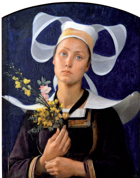
Fig. 3. Hippolyte-Berteaux icono bretón.

su cutis, para morir con bermejeces cálidas en el rostrillo” 53 . El escritor, atrapado en una suerte de voyeurismo casto, de acecho del nacimiento de la emoción, percibe como si una brisa orease de dentro a fuera “las líneas femeniles del cuerpo” y termina bendiciendo a la primavera, capaz de arrancar el deseo natural incluso de las monjas.