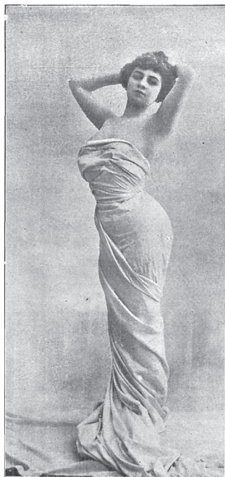
Fig. 2. Modelo en La vida galante .

Aunque por las páginas de Dicenta desfilan vírgenes, prostitutas y damas burguesas, este no se detiene en tipos femeninos con una interioridad compleja como la de los mencionados, tan propia de las heroínas novelescas del momento, a la manera de las modernas atormentadas “aquejadas de los nervios”, de las maduras bellas valleinclinianas, enfermas y estilizadas, o de las refinadas, demoníacas y voluptuosas aristócratas d’annunzianas, de carácter egotista por saberse espiritualmente superiores. A los ojos de Dicenta, D’Annunzio parece aún lejos de los salones y los teatros burgueses madrileños, que se encuentran cuajados en cambio de mujeres frívolas, pendientes de su posición y de los cuidados y vanidades cotidianos. La voluptuosidad en sus descripciones es esencialmente física y se halla de continuo realzada por el lujo de los vestidos y los escenarios, o por un entorno natural y sencillo.