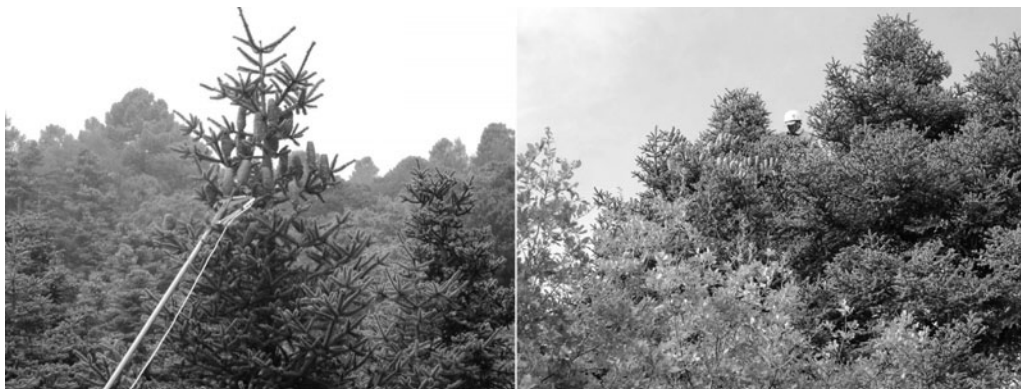
Figura 1. Muestra del sistema de recolección según la altura de los árboles

Se analizaron 10 megagametofitos maduros por cada árbol (Tabla 1). En una primera fase,