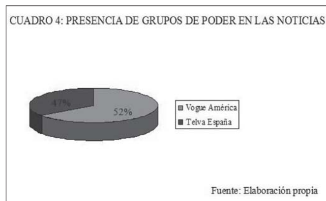
CUADRO 4: PRESENCIA DE GRUPOS DE PODER EN LAS NOTICIAS

En el caso de Telva España la publicidad ocupa un 30% del contenido. El resto es información con altos índices de manipulación del lenguaje. Las marcas anunciadas en Telva España son firmas de moda, medios de comunicación pertenecientes a Unidad Editorial, entidades financieras (Banco Santander) y empresas del sector servicios. En ambos casos, la calidad informativa de las dos revistas queda en entredicho al registrarse un volumen muy alto de imágenes publicitarias de empresas que financian las publicaciones.