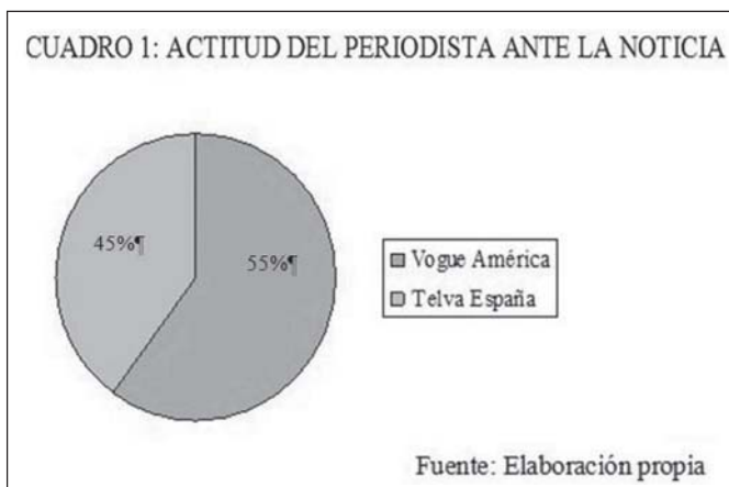
CUADRO 1: ACTITUD DEL PERIODISTA ANTE LA NOTICIA

La actitud del periodista ante el hecho noticioso es fundamental. En un 55% de los textos analizados de la revista Vogue América , el redactor se encuentra en el centro de la información. Sin embargo, no duda en incluir en la crónica o en el reportaje pertinente alusiones a la firma y al grupo empresarial al que pertenece la marca, trayectoria del holding , e incluso activos financieros. En el caso de Telva España , un 45% de los textos analizados cuentan con la presencia del periodista especializado en moda. Este gráfico muestra un reparto de porcentaje muy igualado entre ambas publicaciones. No se observan grandes diferencias entre las dos revistas.