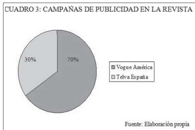
CUADRO 3: CAMPAÑAS DE PUBLICIDAD EN LA REVISTA

Este gráfico nos aporta información precisa. Confirma la intoxicación mediática en las revistas especializadas de moda analizadas. Del 100% del espacio de Vogue América un 70% del contenido es publicidad. Más de la mitad. La publicidad tiene un protagonismo casi absoluto frente a la información periodística. El análisis de la publicidad demuestra que las marcas anunciadas en la revista Vogue América son accionistas de Condé Nast, firmas pertenecientes a grupos empresariales de moda y lujo que pagan cantidades desorbitadas por aparecer en esta publicación, marcas de tecnología con las que Condé Nast ha firmado acuerdos e incluso referencias a la banca internacional con campañas publicitarias de American Express.