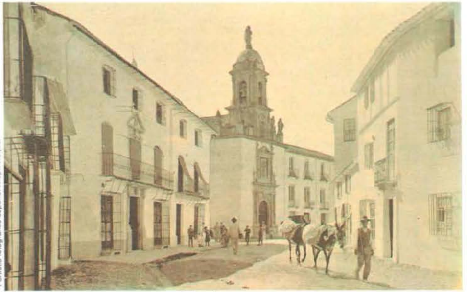
"Pantallo fotográfico español"

La vida política local durante el segundo periodo republicano giró, en general, en torno a las banderías capitaneadas por "valverdistas" —de orientación conservadora y monárquica— y "nicetistas" —republicanos y liberales—. Precisamente, el control municipal de estos últimos facilitó sobremedida que la sedición militar que espo-