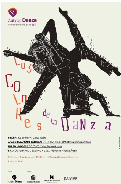
Ilustración de la colección “Cartelería”

Lámina de la colección “Banco de Imágenes”.