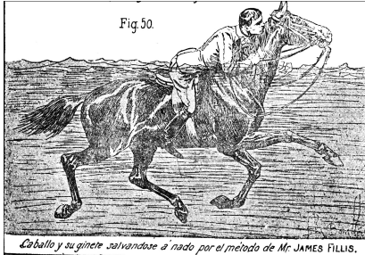
Lámina de la colección “Banco de Imágenes”.

Helvia estructura sus contenidos en 6 grandes comunidades: