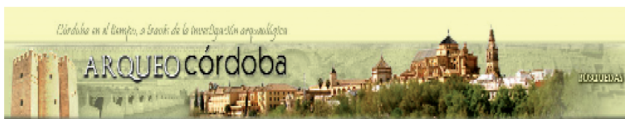
Portada de la colección “Anales de Arqueología Cordobesa”

Revistas de la UCO. En esta comunidad se albergan las revistas editadas por la Universidad de Córdoba o en colaboración con ella, y aquellas otras que han solicitado incorporarse a la colección y que han firmado un acuerdo para ello con la Universidad.