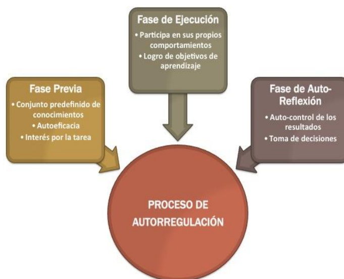
Figura 2: Fases del proceso de autorregulación del aprendizaje del estudiante Fuente: Elaboración propia a partir de las aportaciones de Zimmerman (2000)

En la segunda fase, la fase de ejecución, el estudiante comienza a participar realmente en los comportamientos propios y necesarios para lograr con éxito sus objetivos. En concreto, el estudiante es capaz de realizar un seguimiento al progreso en su propio aprendizaje, así como el uso de estrategias seleccionadas para realizar las tareas de aprendizaje. Durante la última fase del modelo, la fase de auto-reflexión, los estudiantes usan el autocontrol de los resultados para tomar decisiones con respecto a su desempeño en el aprendizaje. Dependiendo de la naturaleza de los resultados, así como de las atribuciones, los estudiantes realizan juicios auto-evaluativos que pueden afectar al curso futuro de las acciones relacionadas con la primera fase del modelo, la fase de previsión. Los estudiantes autorregulados deben comprometerse en un circuito de retroalimentación cíclica hasta que alcancen con éxito sus objetivos.