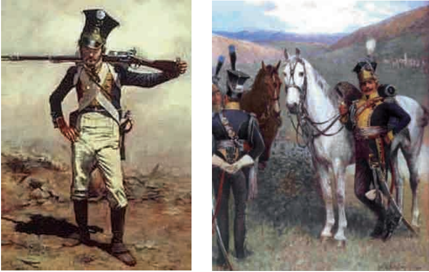
Fig. 1: Soldado perteneciente a la Legión del Vístula/Lancero de la Legión del Vístula.