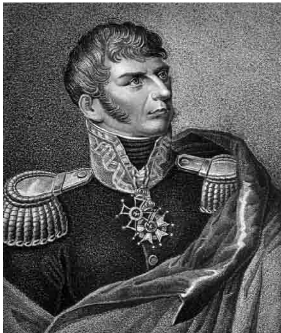
Fig. 2: Retrato del coronel polaco Józef Chłopicki.