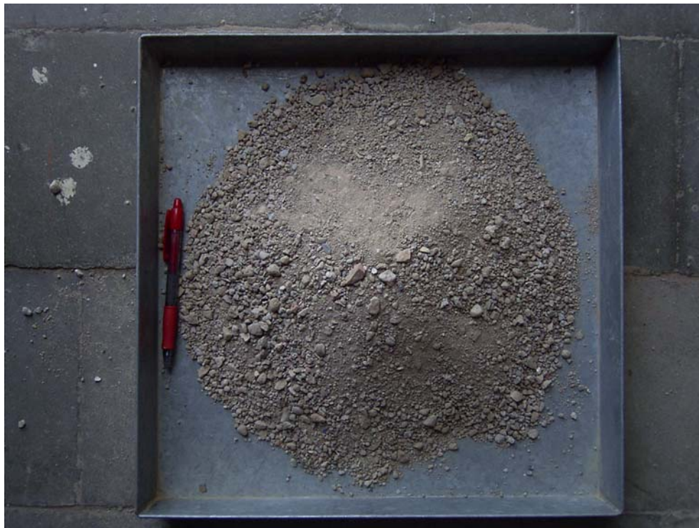
Figura 1. Árido reciclado de tamaño 0-10 mm

En la figura 1 y figura 2 se puede observar el árido reciclado de tamaño 0-10 mm y el árido reciclado 10-40 mm.