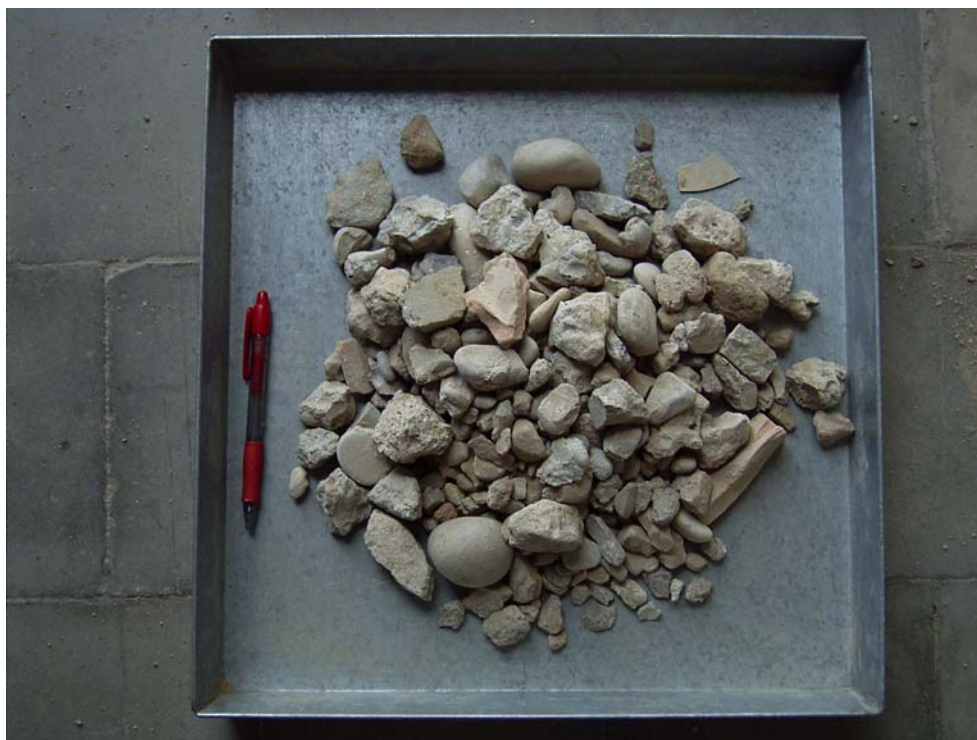
Figura 2. Árido reciclado de tamaño 10-40 mm