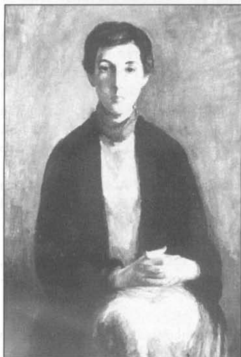
Mercedes Gal (1953), Centro de Arte Reina Sofía. Medalla de Primera Clase en la Exposición Nacional de Bellas Artes de 1954.