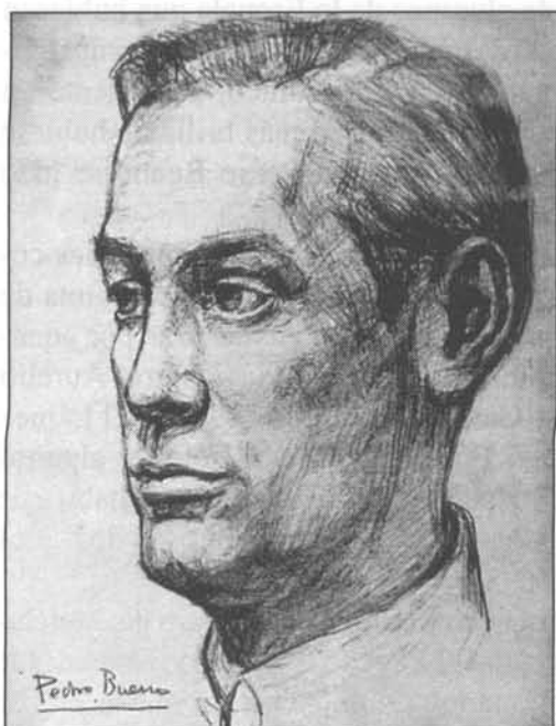
Camilo José Cela (h. 1947).