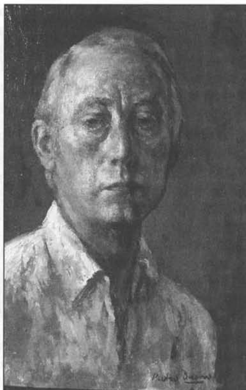
Autorretrato (h. 1972).