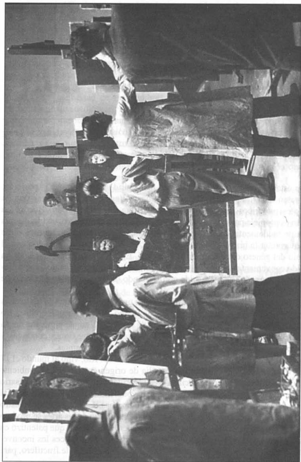
La clase de Colorido, de la Escuela Especial de Pintura (Madrid, h. 1931).