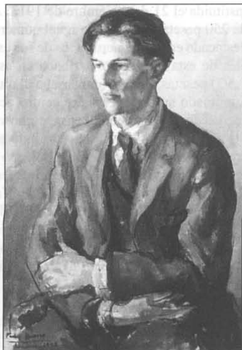
Joven inglés (1948). Museo de la R.A.B.A.S.F. (Madrid).