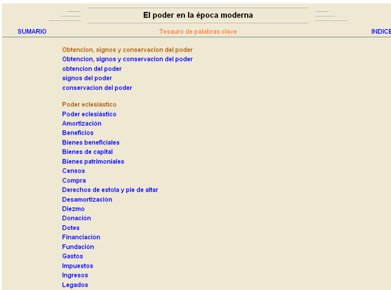
Figura 5.- Imagen Tesaurus de palabras clave que pueden localizarse en todo el texto.

Desde la pantalla Tesaurus de palabras clave se facilitan las búsquedas hacia todo el texto (fig. 5), sin importar el tema, si bien busca exactamente palabras, por lo que, si no se han formulado tal cual aparecen, la búsqueda puede ser infructuosa, pero, cuando se localiza el término, éste aparece marcado en negrita en un extracto de unas pocas líneas, desde donde se puede saltar al contexto completo si se desea conocerlo (fig. 6).