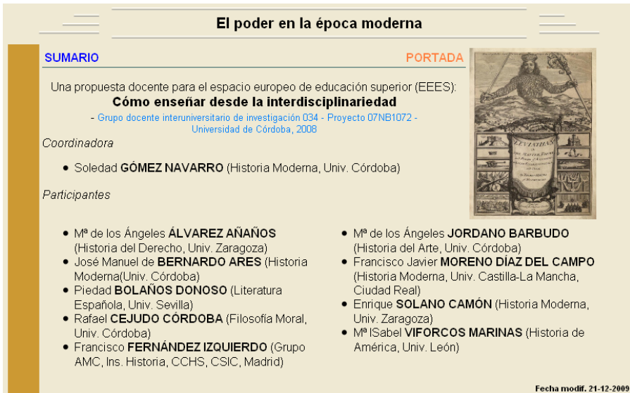
Figura 1.- Imagen de la portada principal de acceso a El poder en la época moderna

actuación con el alumnado y resultados obtenidos al comparar las respuestas al pequeño cuestionario acordado en junio sobre nuestros respectivos trabajos- y sea casi un punto y final de estos dos años largos del Proyecto.