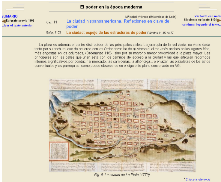
Figura 4.- Imagen del desarrollo del tema La ciudad hispanoamericana. Reflexiones en clave de poder . Obsérvese la inserción de una imagen, con su pie, y un enlace externo a un servidor externo.

Como fácilmente puede comprobarse, en esencia consta de los siguientes elementos: Una pantalla de entrada – Portada – (fig. 1), otra de índice general – sumario –, y junto al título de cada tema una versión en PDF. Cada una de las pantallas está identificada por un