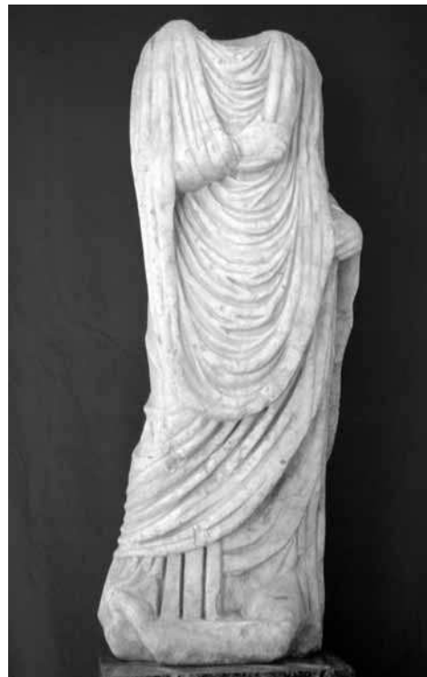
LÁMINA 4: Estatua togada ¿femenina? hallada en Ronda de los Tejares-Avda. del Gran Capitán.

De dimensiones considerablemente menores que la anterior –de hecho su tamaño parece corresponder a una figura me-