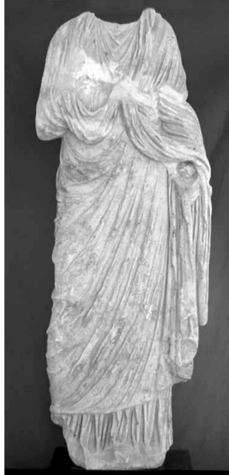
LÁMINA 6: Estatua femenina vestida del tipo Eumachia-Fundilia localizada en la C/ Gondomar (Foto: autor).

En cuanto a las dos estatuas femeninas vestidas a las que hicimos referencia más arriba, ambas fueron halladas en zonas intramuros de la Córdoba romana, si bien por su morfología y características tipológicas podrían haberse vinculado sin problemas a enterramientos de cierta monumentalidad. La primera apareció en 1990 en la calle Gondomar, en pleno centro de la ciudad actual (Fig. 1, n° 7), al acometerse obras de infraestructura en plena vía (BAENA, 1991) 25 .