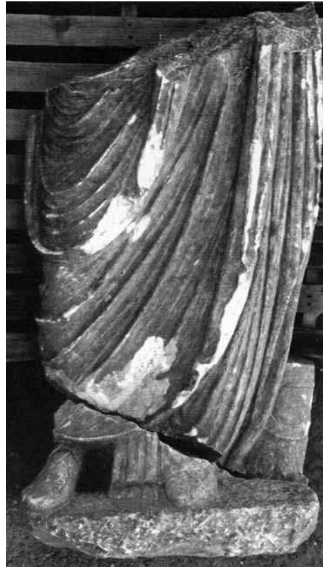
LÁMINA 3: Togado recuperado en el Tablero Bajo.

GUET-VARGAS 2005: 29 ss.). La parte de la escultura que pudo recuperarse corresponde sólo a la mitad inferior (esto es, piernas, pies