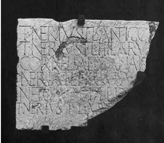
LÁMINA 2: Placa con inscripción relativa a una familia de libertos, descubierta en la iglesia de San Andrés (Foto: Serrano-Atencia, 1981).

abre con el nombre en nominativo (y no en dativo como cabría esperar) del joven decurión astigitano C. Furnio Fortunato, de tan sólo 18 años, a quien el ordo de su ciudad natal concedió diversos honores fúnebres, entre ellos una estatua (CIL II 2 /7, 306). No faltan tampoco en el texto, abreviadas, las típicas fórmulas funerarias: pius in suis, hic situs est y sit tibi terra levis . Dos han sido los datos proporcionados por este epígrafe que han suscitado mayor interés: por un lado, la escasa edad con la que el personaje ingresó en el senado de Astigi ; por otro, la aparición del basamento funerario en una ciudad distinta (la capital de la provincia) a la que le rindió homenaje. Lo primero se explicaría por la pertenencia del infortunado C. Furnio Fortunato a una de las familias principales de Astigi en época tardoantonina; lo segundo por su probable fallecimiento repentino en Colonia Patricia , a la que podría haberse trasladado para iniciar su trunca carrera política y donde habría sido sepultado (CIL II 2 /7, 306; MELCHOR, 2006a: 273-275).