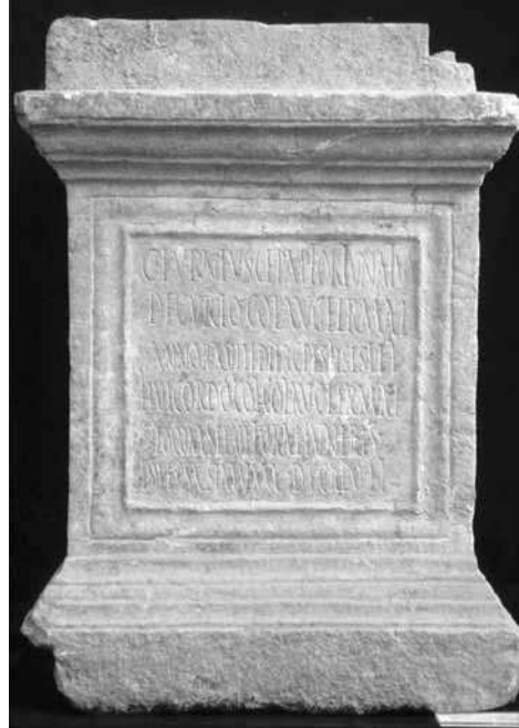
LÁMINA 1: Pedestal de estatua de C. Furnio Fortunato, hallado en Avda. de las Ollerías (Foto: autor).

El primero de los epígrafes utilizó como soporte un pedestal de mármol grisáceo de casi un metro de altura y en buen estado de conservación (Lám. 1). Se halló en la antigua Avda. Obispo Pérez Muñoz –hoy Avda. de las Ollerías (Fig. 1, nº 1)–, cerca del Convento de San Cayetano ( HEp 3, 1993, 341); una extensa franja de terreno pródiga en hallazgos funerarios romanos (algunos de ellos monumentales, correspondientes a distintas fases) comprendida entre las necrópolis septentrional y oriental (vid. VAQUERIZO, 2002a; 2002b) 11 . Se conserva en el Museo Arqueológico y Etnológico de Córdoba 12 .