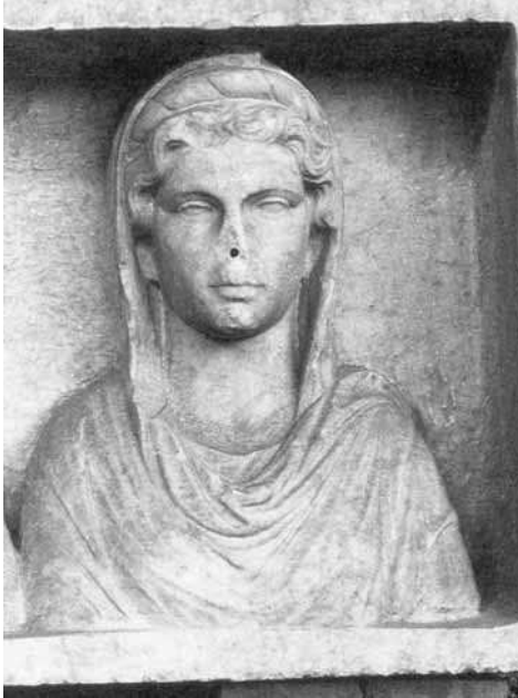
LÁMINA 10: Relieve funerario del Museo Nazionale Romano (detalle) (Foto: Kockel, 1993).