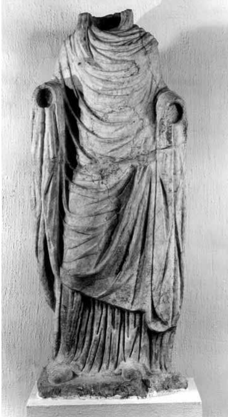
LÁMINA 9: Estatua femenina vestida de Segobriga (Foto: DAI, Madrid).