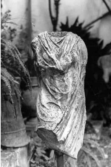
LÁMINA 7: Estatua femenina vestida del tipo “pequeña herculanesa”, descubierta en el palacio de Torres Cabrera.