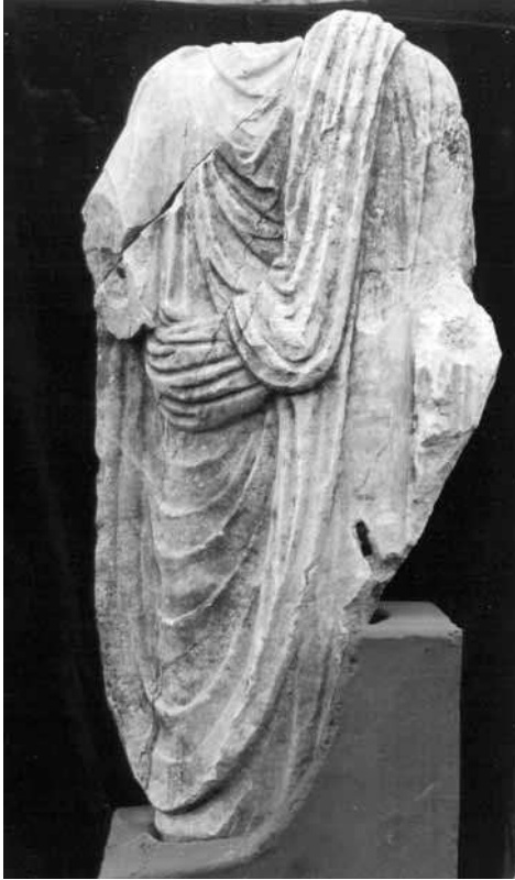
LÁMINA 5: Togado procedente de la iglesia de S. Lorenzo

natural 21 , corresponde nuevamente, como la primera, a un individuo masculino (Lám. 5). Fue descubierta de manera casual bajo el ábside de la iglesia bajomedieval de San Lorenzo, situada extramuros y unos 400 m al Este de la ya mencionada parroquia de San Andrés (Fig. 1, n° 6) 22 . Se trata de una zona que, como veremos a continuación, ha pro-