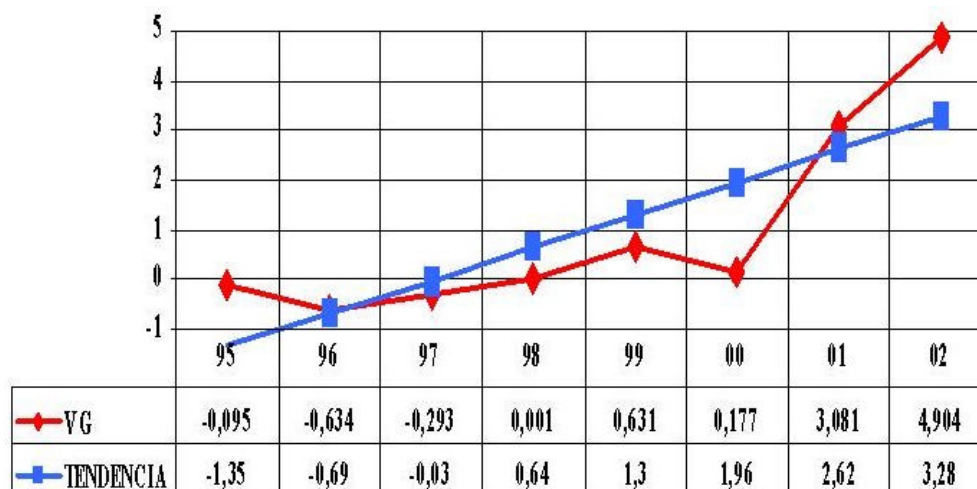
Figura 2. Evolución de las medias de los valores genéticos directos para el peso a los 180 días de los terneros Retintos. (Evolution of the average direct genetic values for weight at 180 days of age for Retinta calves).

Para poder aproximarnos a una estimación de la proyección económica de la mejora de la raza bovina en la cabaña ganadera podríamos analizar los