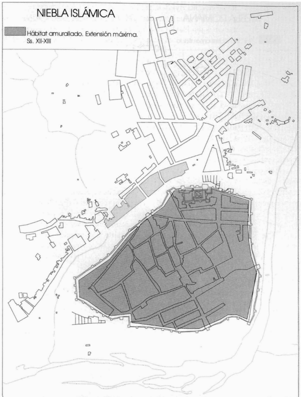
Figura 4. Niebla islámica. Hábitat amurallado y arrabal.