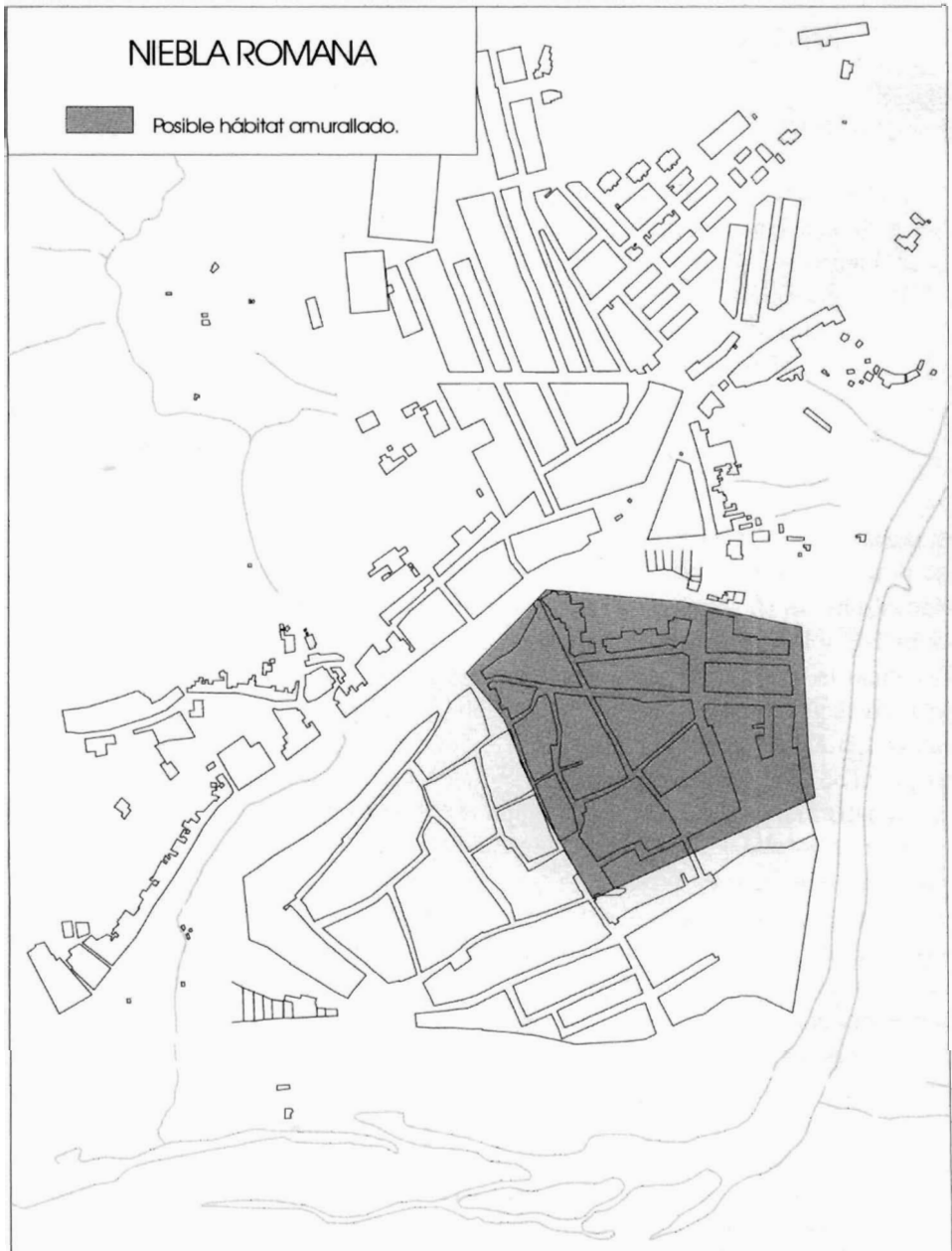
Figura 3. Niebla romana.