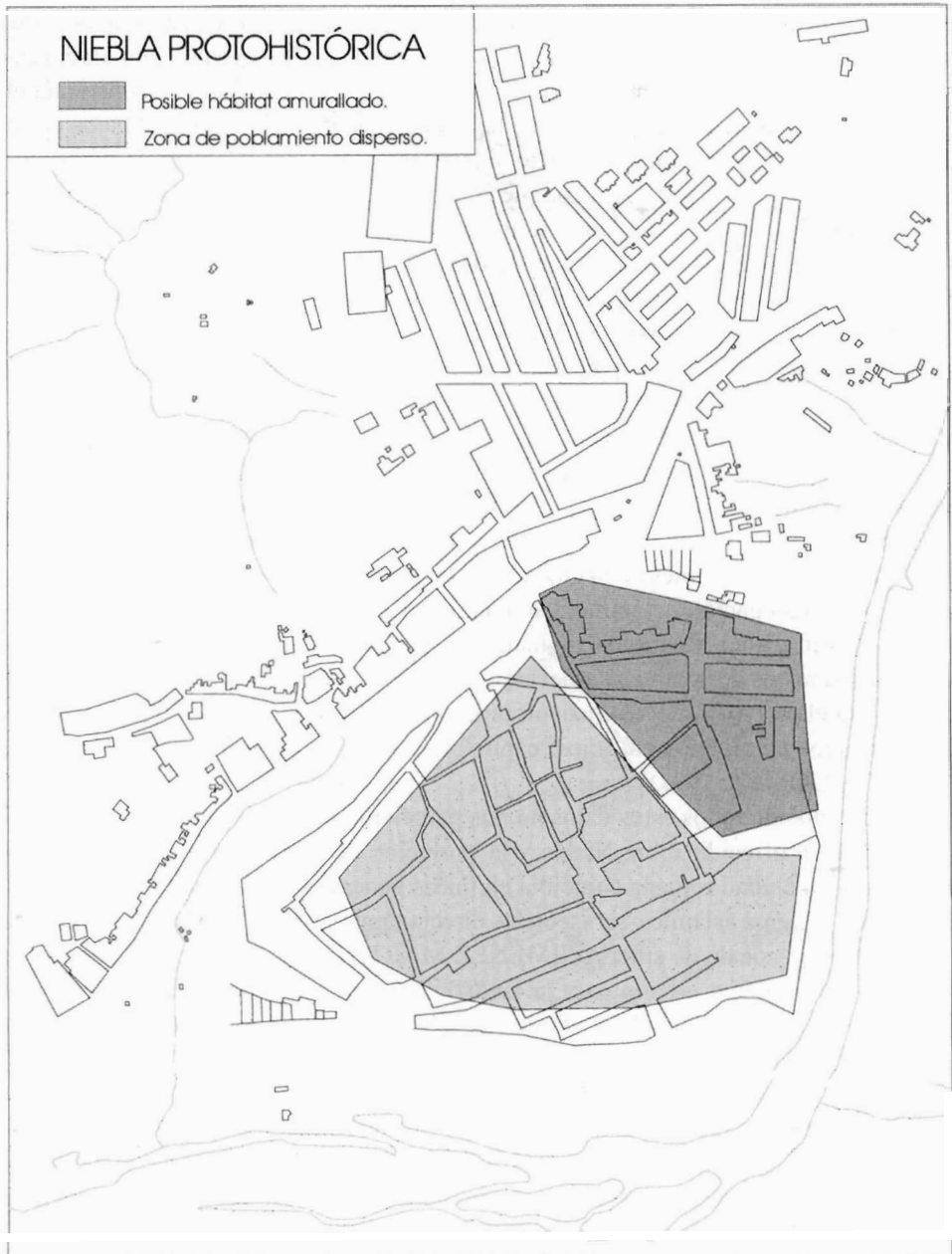
Figura 2. Niebla Protohistórica.