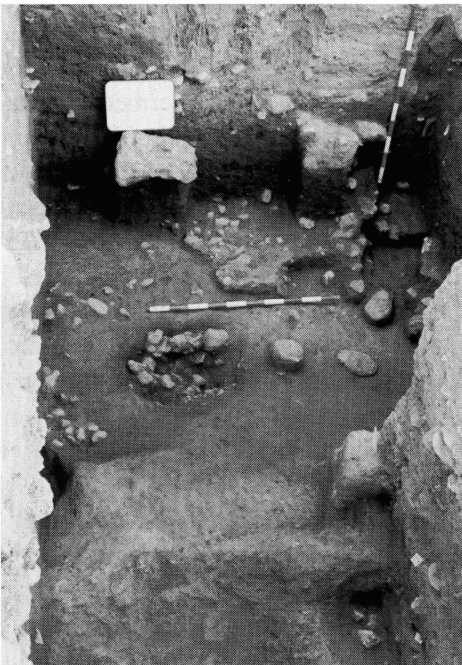
Lámina I: Detalles de las intervenciones en Plaza de Santa María, 7 y C/. Constitución, 10.