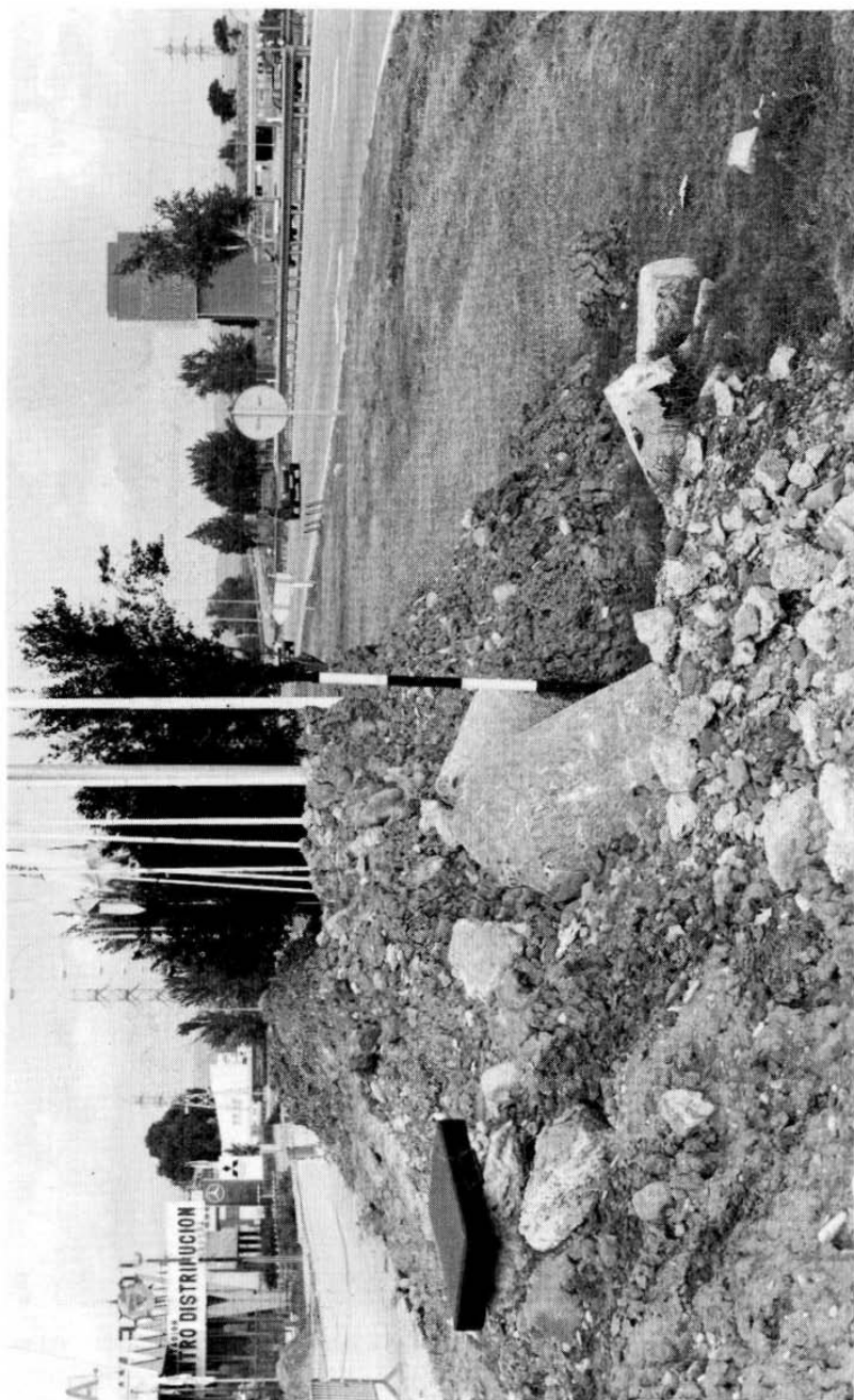
Lámina I. Vista panorámica del lugar donde se produjo el hallazgo.