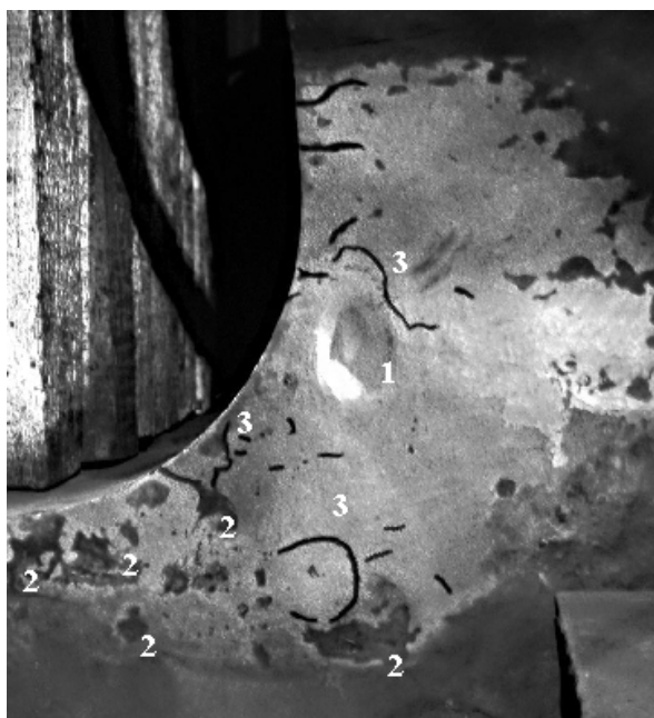
Рис. 1. Зачищенная поверхность литой крупногабаритной детали с дефектами типа подкорковый пузырь (1), усадочная раковина (2) и трещина (3)

Основным способом получения крупногабаритных базовых деталей является литье, характеризующееся множеством разновидностей технологической дефектности. На рис. 1 показана поверхность литой крупногабаритной детали с дефектами (фотография сделана при выполнении экспертизы технического состояния объекта специалистами ЗАО «Прочность»).