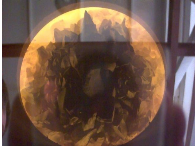
Рис. 2. Дендритна структура робочої лопатки, отриманої на установці УВНК-8П (м. Запоріжжя, «Мотор Січ»).

Беручи до уваги зростаючу конкуренцію на світовому ринку авіаційного приладобудування, яка зумовлює високі вимоги по підвищенню надійності, робочої здатності і економічності ГТД перед розробниками і виробниками постає завдання збільшення гарантованого ресурсу, підвищення потужності двигунів при одночасному зниженні їх загальної маси. Тому для цього пропонується застосовувати поєднання інформаційно-виміральної системи на основі пірометра спектрального відношення (ДПР-1) та телевізійної камери на основі ПЗЗ-матриці