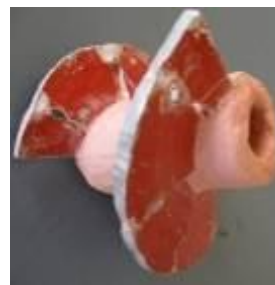
Рис. 1. Схема форми із закладною ГЗ для виготовлення ШЗ (а) та загальний вигляд таких заготовок

У випадку виконання опорного елемента ШЗ із поліаміду, армованого скловолокном, слід вприскувати розплавлену масу в нагріту форму. При цьому для отримання рівномірної дрібнокристалічної структури в поліаміди вводять різні домішки, проводять додаткову термічну обробку заготовок в інертних рідких середовищах. Як інертні рідини рекомендовано використовувати мінеральні масла, парафін, церезин, кремній та інші органічні рідини.