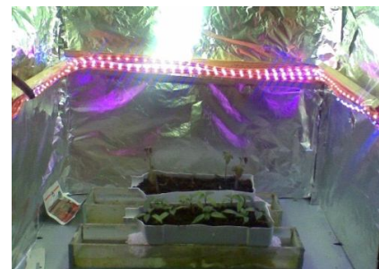
Рисунок 2. Комбінований опромінювальний пристрій в міні-теплиці «Флора»

де V - джерело постійного струму; K1 – вимикач; C1 - конденсатор живлення спалаху; C2 - конденсатор 0,1 мкФ 300 В; X1 - лампа ИФК-120; R1 - опір 0,5 МОм 1 Вт; K2 - контакти включення спалаху; T1 - трансформатор імпульсний.