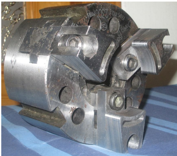
Рисунок 2. Механізований токарний затискний патрон із адаптивними ЗЕ для затиску заготовок в діапазоні діаметрів 60-70 мм

На основі конструктивної схеми, приведеної на рис.1,а, розроблено конструкцію та виготовлено дослідні зразки адаптивних кулачків для оснащення механізованого токарного затискного патрона (рис.2) для підтвердження теоретичних досліджень умов контактування ЗЕ із заготовкою, стану зони адаптації, що проводилися за допомогою методу скінченних елементів, який реалізовувався САЕ-системою. Аналіз результатів моделювання [3] показав те, що затискна частина адаптивного кулачка працює в зоні пружних деформацій і забезпечує її повний контакт із заготовкою в заданому діапазоні діаметрів при затиску.