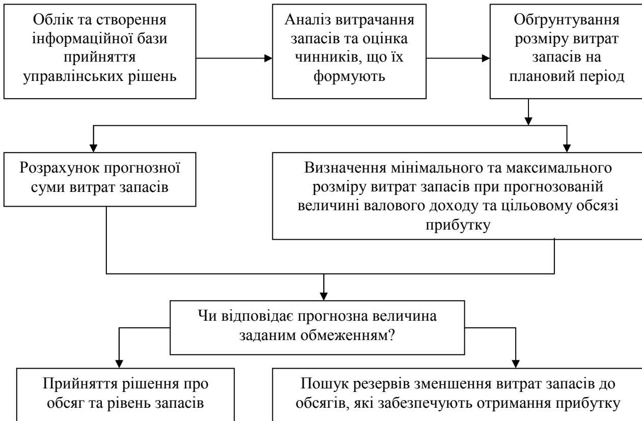
Рис. 1. Взаємозв'язок облікової функції управлінського обліку запасів з іншими функціями управління в процесі прийняття рішень (за даними [4])

Існують й недоліки при наявності надлишкових запасів на підприємстві, тобто має місце вилучення з обороту грошових коштів, які могли б бути залучені в інших планах керівництва щодо покращення та удосконалення діяльності підприємства. Отже, звідси слідує, що підприємство певну частину своїх можливих доходів марно витрачає на забезпечення зберігання товарно-матеріальних цінностей.