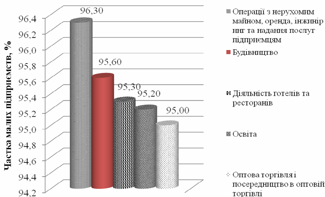
Рис. 2. П'ять галузей України із найбільшою часткою малих підприємств Складено автором за [4]

необхідних додаткових компетенцій можна або за рахунок створення (придбання) відповідних структурних одиниць, або шляхом налагодження партнерських взаємовідносин (від простого субпідряду до мережових структур і бізнес-альянсів) з іншими самостійними організаціями. Перший шлях, як свідчить сучасна практика, є дорогим, негнучким і забезпечує конкурентні переваги лише у короткостроковому періоді. В межах партнерських відносин у кожного із учасників з'являється унікальна можливість використовувати на взаємовигідних умовах основних компетенцій решти учасників. Суттєвими перевагами малих підприємств від участі у партнерських зв'язках з великими компаніями є відносна стабільність забезпечення замовлення, гарантований збут, зменшення трансакційних витрат, фінансова і технологічна підтримка, навчання сучасним методам управління тощо.