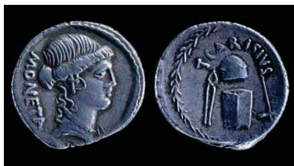
Figura 1. Denario de plata con la imagen de la diosa Juno Moneta en el anverso y en el reverso utensilios para acuñar monedas con la inscripción “TCARISIVS”.

3 Juno, equivalente romano de la diosa griega Hera, integraba junto a Zeus (su hermano y esposo) y Minerva la Tríada Capitolina. Fruto de su relación con aquél nacieron sus tres hijos Marte, Vulcano e Iliú. Como diosa principal del panteón romano eran muchos los atributos que la acompañaban para los cuales existían diferentes epítetos. En su papel de diosa del matrimonio eran varios los adjetivos tales como: Interduca (“la que lleva la novia al matrimonio”); Domiduca (“la que lleva a la novia a su nuevo hogar”); o Cinxia (“la que pierde la faja de la novia”). En otros ámbitos encontramos a Juno identificada con apelativos como Regina (“reina de las divinidades”); Lucina (“la que trae niños a la luz”) y Lucetia (“la que trae luz”), ambos relacionados con su papel de ayudante en los partos; Pronuba (“Matrona del honor”); Pomona (“de la fruta”); o Moneta (adorada como protectora de las riquezas del Estado Romano).