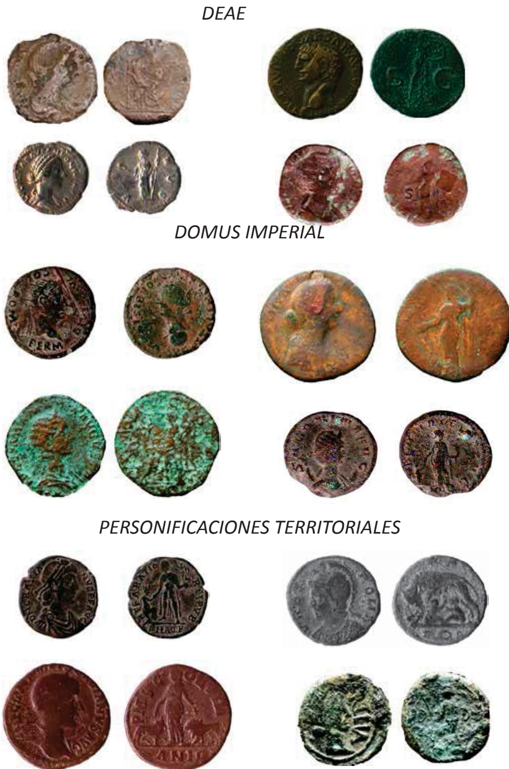
Figura 14. Conjunto Deae/Domus Imperial/Personificaciones Territoriales.