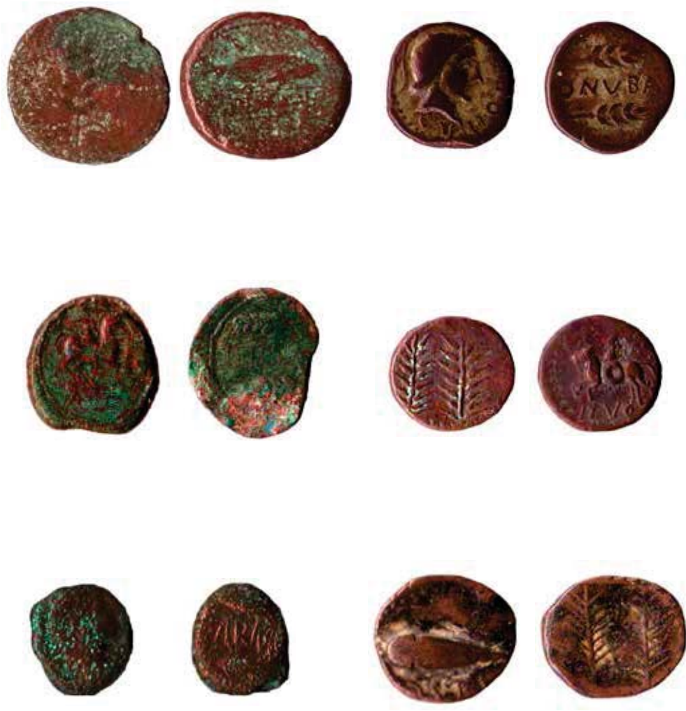
Figura 18. Conjunto Otras Iconografías.