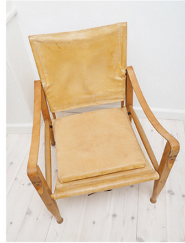
KAARE KLINT "SAFARISTOLEN"

Jeg manglede et lædermøbel i min stue, og denne ikoniske og tidsløse stol af Kaare Klint, designet i 1933, havde længe stået på ønskelisten: Derfor valgte jeg at investere i en brugt af slagsen, som har fået godt med patina og derfor, efter min mening, fremstår smukkere end fra ny. Generelt set synes jeg, at lædermøbler er smukkeste, når de har fået noget alder og liv, og anbefaler klart at lede efter lædermøbler secondhand.