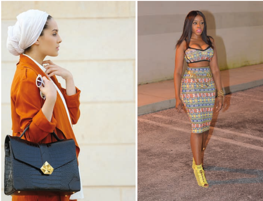
BILLEDER: SCREENSHOTS FRA (VENSTRE MOD HØJRE) THE HYBRID HEADPIECE OG STYLE FLUENCY

I forhold til hvordan modeblogs ser ud i en global sammenhæng, er det danske bloggerfelt forholdsvis homogent. I britisk og amerikansk sammenhæng findes der store kommercielle modeblogs, dedikeret til mode for kvinder, der går med tørklæde (fx britiske www.hijabstyle.co.uk eller kuwaitisk-amerikanske www.hybridheadpiece.com ), eller afrikansk-amerikansk identitet (fx amerikanske www.stylefluency.com og ligeledes amerikanske www.pocketsandbows.com ). Ligeledes findes der globalt set langt flere mandlige modebloggere, bloggere med et handicap og andre minoriteter repræsenteret.