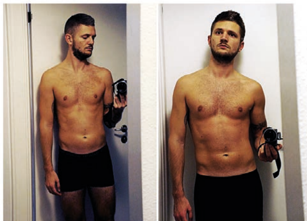
Før/efter. Ikke den store forandring udenpå ud over længere hår og et, om muligt, endnu mere akavet ansigtsudtryk. Men indeni kan det mærkes!