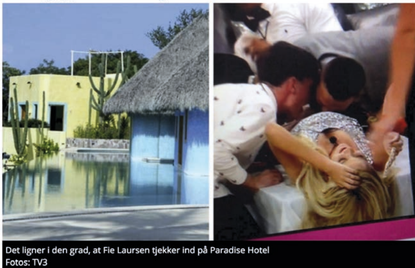
BILLEDER: SPEKULATIONER I ARTIKEL FRA SE OG HØR 50