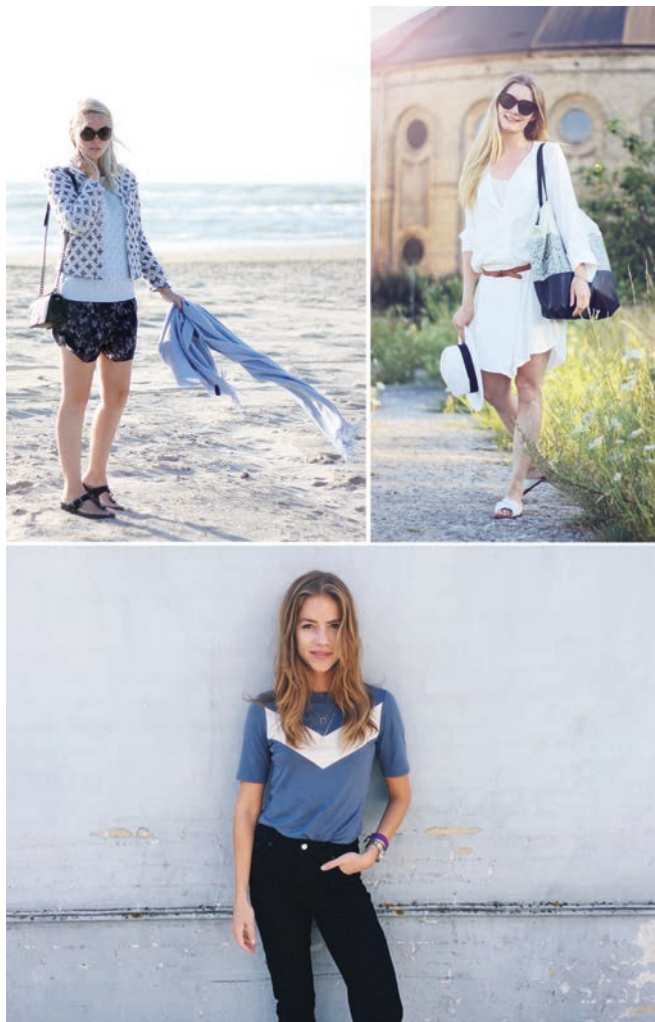
BILLEDER: FRA (FRA ØVERST TIL VENSTRE) CLAMOUR 4 GLAMOUR, PASSIONS FOR FASHION OG TRINES WARDROBE

Den typiske danske modeblogger er en kvinde i tyverne, og i det hele taget er fordelingen på bloggerens køn meget ensidig, da ganske få mænd er modebloggere. Den danske modeblogsfære kan således også siges at være et feminiseret rum. Både et rum, hvor værdier og adfærd, som historisk er koblet til det feminine, dyrkes og praktiseres, men det er også et rum, hvor anerkendelse lader til at være den primære interaktionsform. Læserne roser bloggerne, og bloggerne roser læserne. Bloggens læsere bruger ofte modebloggeren som et (forbrugs- og mode)forbillede, spejler sig i bloggerne og bruger