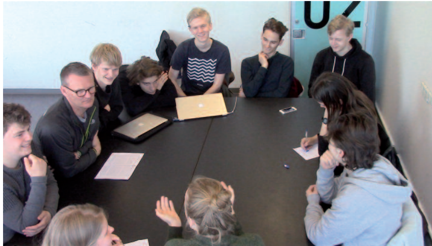
Variation af dialogcirklerne anvendt i danskundervisningen på Rysensteen Gymnasium i København. Rundbordsopstillingen understøtter at dialogen mellem eleverne er i centrum.