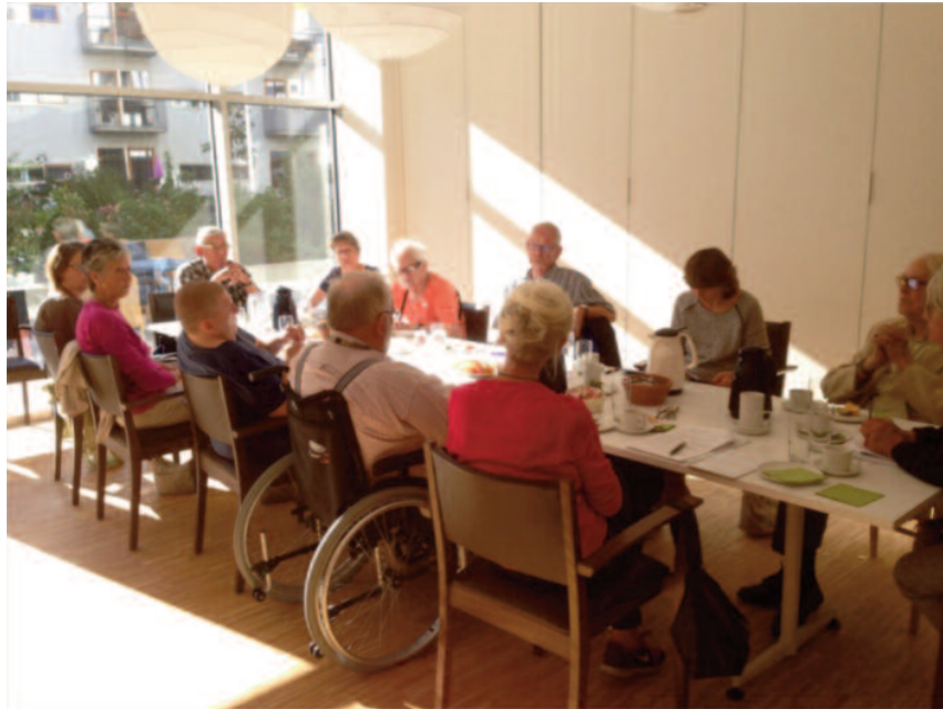
Ideudvikling i arbejdsgruppen for beboere og pårørende.