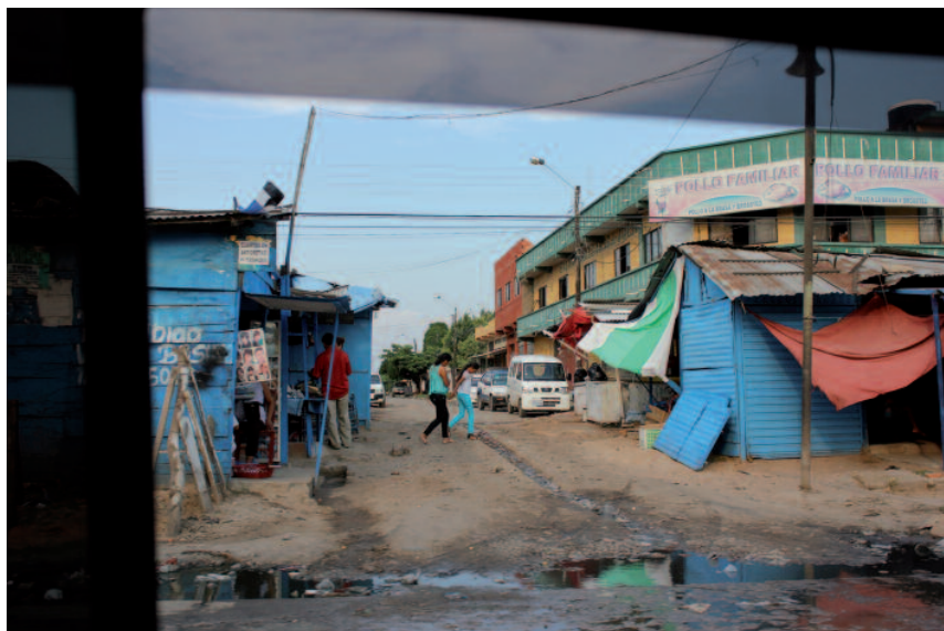
Gade i udkanten af Santa Cruz, Bolivia.