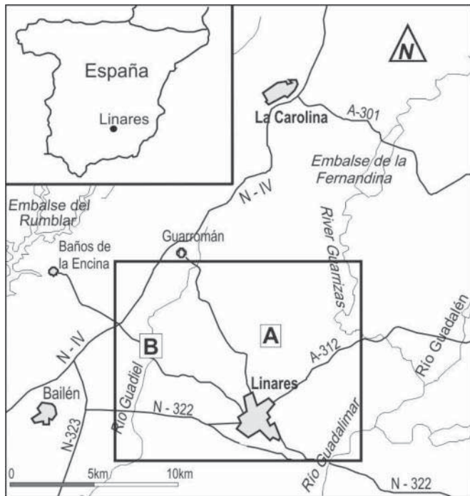
Fig. 1.- Situación geográfica de sector estudiado. Fig. 1.- Location of the study region.

por materiales triásicos, miocenos y cuaternarios. Los materiales del Triásico, predominantes en el sector, presentan