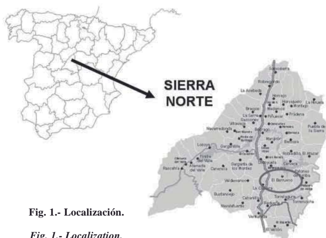
Fig. 1.- Localización.

Desde el punto de vista de la vegetación y de acuerdo a las características de zonificación biogeográfica utilizada por Peinado y Rivas (1987), la zona de estudio se encuentra enmarcada en el reino Holártico, distrito Guadarramense y piso