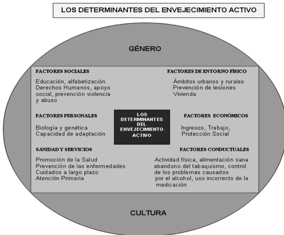
Figura 2. Los determinantes del envejecimiento activo