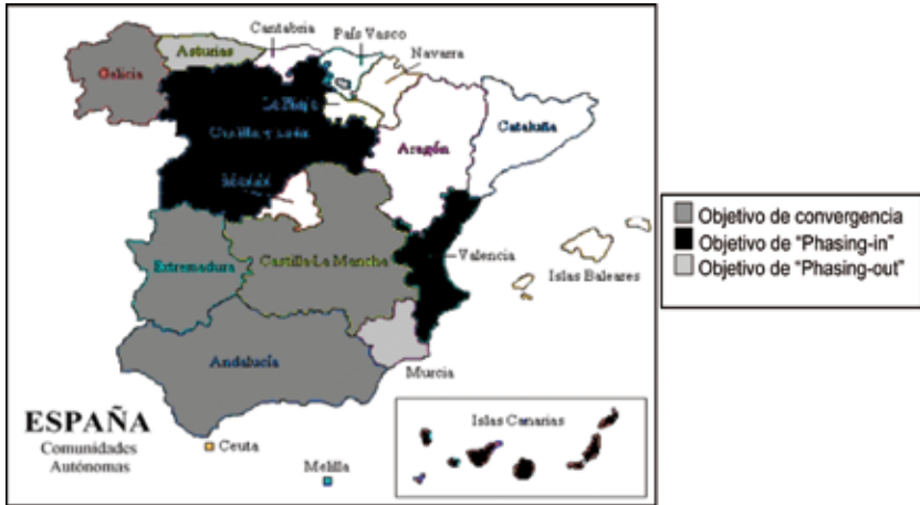
MAPA 2: LOS OBJETIVOS DE CONVERGENCIA, "PHASING-OUT" Y "PHASING-IN" EN ESPAÑA (2007-2013)