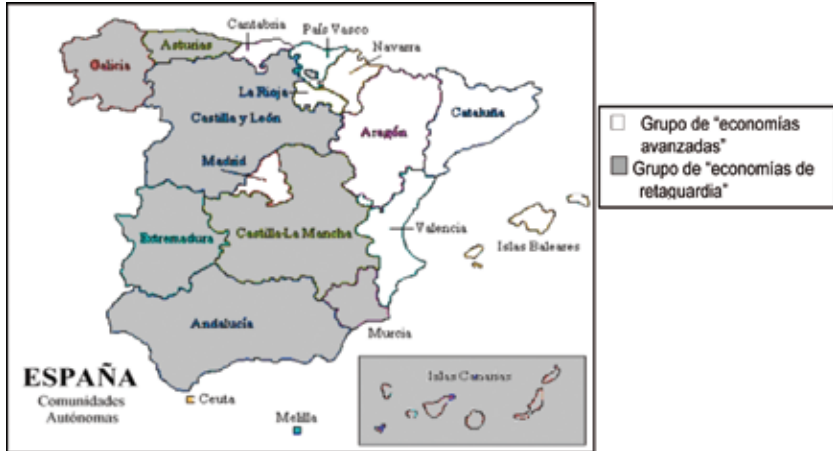
MAPA 1: LA POLARIZACIÓN DE LAS ECONOMÍAS REGIONALES

llas), el noroeste (Galicia y Asturias) y el sur (Andalucía, Murcia, Ceuta y Melilla y Canarias) de la península. El grupo con “economías más avanzadas” se sitúa en el noreste (País Vasco, Cantabria, La Rioja, Navarra y Aragón), el centro (Madrid) y la zona de Levante (Cataluña, Comunidad Valenciana y Baleares). Esta distribución espacial que hemos caracterizado se ilustra en el Mapa 1.