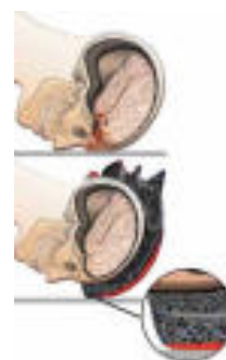
Foto nº 14.- Actividad física y riesgo de contusiones.