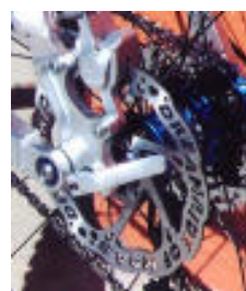
Foto nº 7.- Más imprevistos que tienen solución con herramientas adecuadas.