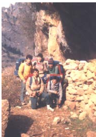
Foto nº 3.- Actividad de senderismo.

El equipo básico de intendencia para una marcha deberá contemplar los siguientes elementos: