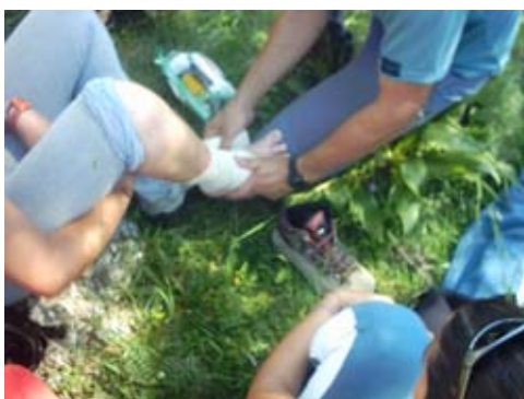
Foto nº 17.- Inmovilización del tobillo.

Los síntomas de esta lesión son: dolor agudo e intenso, hematoma alrededor de la articulación lesionada, dolor a la movilización o al apoyo, cierta inestabilidad y pérdida de sensaciones propioceptivas.