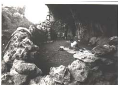
Foto nº 11.- Ejemplo de refugio natural.

Excava un pequeño surco alrededor del refugio a modo de tubería par drenar el agua de la lluvia. Realiza un mullido con cobertura vegetal para aislarte del suelo.