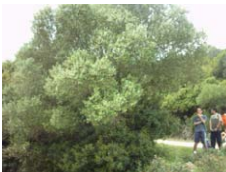
Foto nº 13.- La sombra de un árbol como cobijo para evitar insolaciones.

En una segunda fase más grave se puede entrar en estado de shock, aumentando la temperatura corporal más de 41°C, produciéndose, además, agitación y convulsiones.