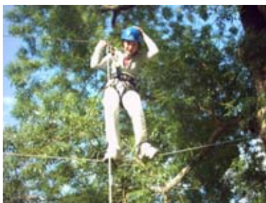
Foto nº 2.- Ejemplo de actividad en el medio natural.