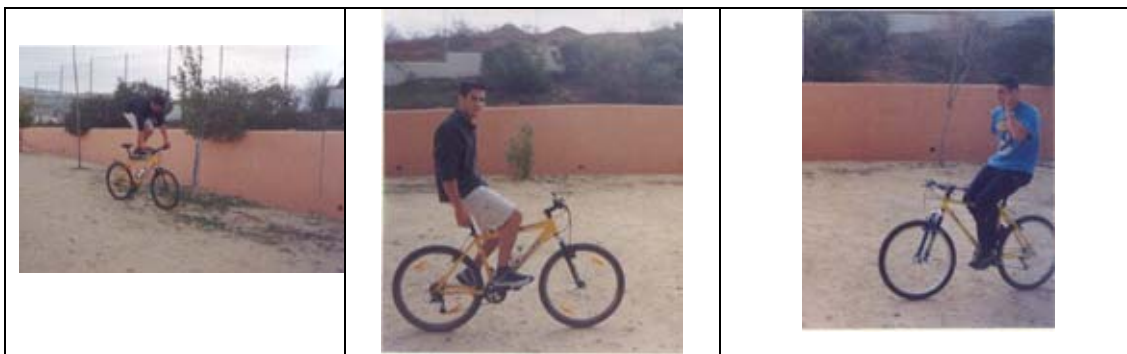
Foto nº 10.- Actitudes irracionales en la conducción de bicicletas, que deben de erradicarse, para prevenir riesgos de lesiones y accidentes.