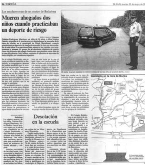
Texto nº 2.- Noticias de prensa vinculadas a la práctica de "deportes de riesgo".

Diferente es cuando las personas implicadas son niños o adolescentes y en concreto alumnos/as que han sufrido un grave accidente, incluso han perdido la vida mientras se hallaban disfrutando en un campamento, parque de atracciones, excusiones, piscinas, practicando un deporte federado, durante el recreo etc, aquí se dispara la alarma y la repercusión social es muy importante. Se convierte especialmente en infausta y catastrófica, de verdadero impacto social y derivación hacia los medios de comunicación cuando este accidente ha acaecido durante actividades complementarias y extraescolares como por ejemplo en el medio natural.