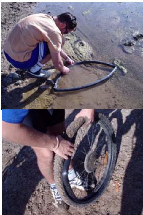
Foto nº 6.- Solucionando imprevistos, un pinchazo.

Como mínimo deberíamos llevar siempre en cualquier salida con nuestra bicicleta el siguiente equipamiento: desmontables para pinchazos, parches, cámara de repuesto, bomba de inflar, pequeña llave inglesa, destornillador, juego de llaves "Allen", cables de frenos, troncha cadenas, faro, piloto, catadióptricos, bombillas de repuesto, radios de repuesto, llave de radios. Para realizar una salida de varios días es necesario llevar, aparte de los elementos básicos de mantenimiento y reparación de la bicicleta, los siguientes accesorios: transportín, alforjas traseras y /o delanteras, faro y piloto, guantes, gafas de sol, culotte, casco y el resto de elementos que utilizaremos en cualquier marcha y acampada.