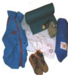
Foto nº 4.- Equipo auxiliar y complementario.