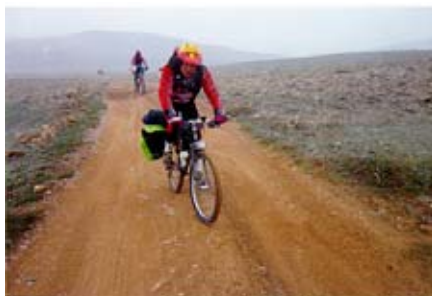
Foto nº 9.- Ruta de btt por caminos marcados para evitar la erosión.

Circulando por caminos y espacios naturales es imprescindible también respetar al máximo el entorno, para ello evitaremos en la medida de lo posible la erosión que ocasionan los rodajes agresivos, frenadas innecesarias, etc.