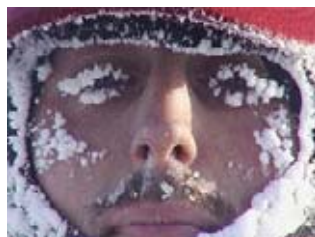
Foto nº 15.- Efecto del frío.

Según EME (1981), los síntomas del aterimiento son: frío intenso, decaimiento físico, torpeza mental y confusión de ideas, somnolencia, pérdida del conocimiento, bradicardia y respiración lenta, bajando notoriamente la temperatura corporal. A pesar de estos síntomas es posible reanimar al accidentado si se le auxilia de manera inmediata. A parte de las condiciones climatológicas, la aparición de este cuadro clínico, se ve favorecida por: