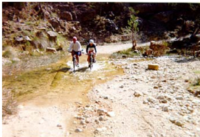
Foto nº 5.- Actividad de bicicleta de montaña.