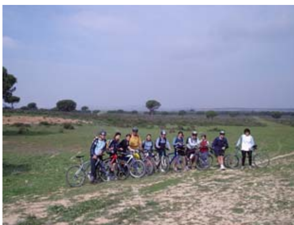
Foto nº 6.- Actividad con el alumnado en btt.

La bicicleta de montaña es la que nos va a permitir por su estructura desplazarnos por caminos y sendas inaccesibles para otro tipo de bicicleta, es increíble experimentar las dificultades orográficas que se pueden superar con estas máquinas. La bicicleta posee un sólido marco ó cuadro construido de diferentes materiales, un manillar plano de una anchura parecida a la de los hombros del ciclista, con fácil acceso a las manetas de los cambios y frenos, todo ello construido en materiales muy diferentes, desde los resistentes y pesados como el acero a los livianos pero más frágiles como el aluminio, hasta materiales de última generación ligeros y resistentes como el cromo-molibdeno, el titanio, carbono...