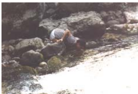
Foto nº 12.- El agua.

El hombre puede permanecer vivo durante bastante tiempo sin ingerir ningún alimento, pero es imposible vivir mucho tiempo sin beber líquidos. Por lo tanto, la búsqueda de agua es un elemento clave de la supervivencia. Por regla general diremos que nunca deberemos beber agua de arroyos que te encuentres en el camino, sobre todo si en su curso alto se encuentran pastizales de ganado, ni de charcas y abrevaderos, tampoco bebas la nieve virgen. Podremos obtener agua de la lluvia, de la nieve descongelada, del rocío de la mañana el cual lo podremos recoger mediante la colocación de una bolsa de plástico alrededor de las ramas de un árbol o una planta. Ciertas plantas como las cañas, los juncos, chopos, hierbas verdes etc, indican la presencia de agua y no sólo eso sino que también nos podemos beber su savia. También se puede obtener agua excavando un hoyo, cubriéndolo con un plástico y situando un recipiente justo debajo, obteniendo así agua de condensación producida por el cambio de temperaturas entre el día y la noche.