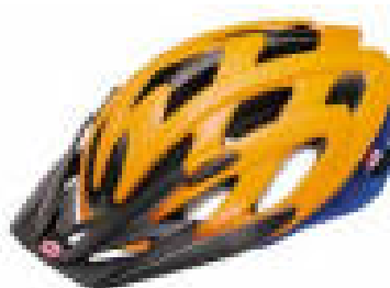
Foto nº 8.- Equipamiento básico.