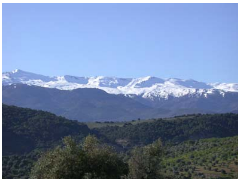
Foto nº 1.- Paisaje.