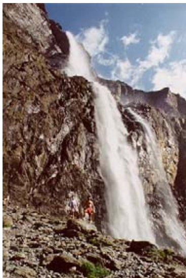
Foto nº 2.- Paisaje.