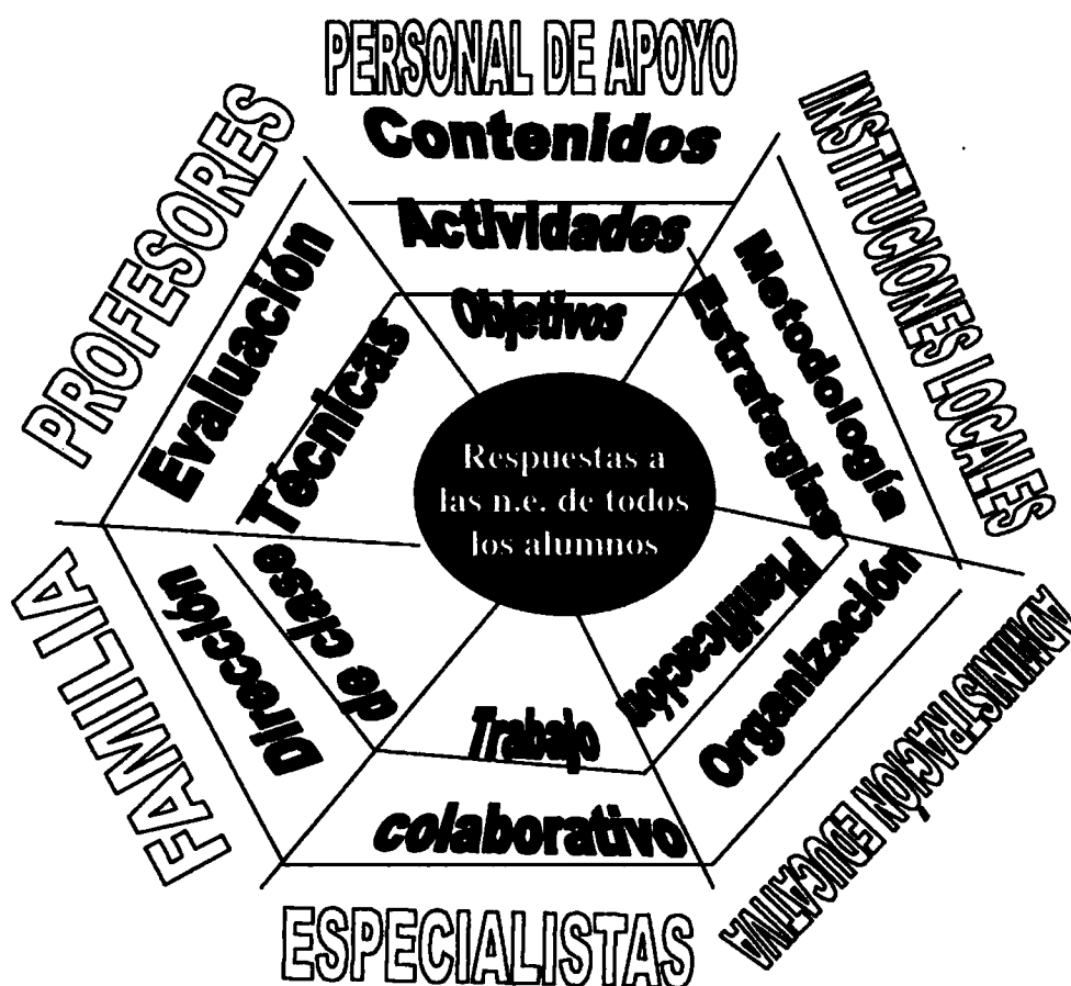
Fig. nº1. Toma de decisiones para la construcción de la tela de araña entre todos los miembros de la comunidad educativa.

La finalidad de la elaboración de esta gran tela de araña, entre todos los sectores implicados en la educación, redundaría ineludiblemente en la mejora de los procesos de enseñanza-aprendizaje, incidiendo todo ello en una enseñanza de calidad.