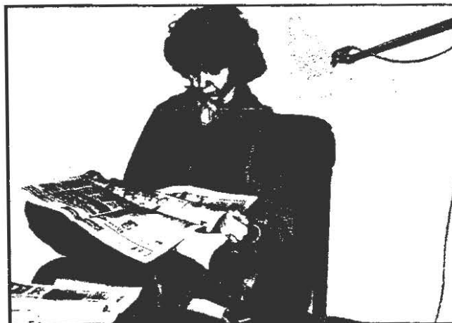
For at gøre forsøget med genevirkning mere livsnært blev forsøgspersonerne anbragt i en behagelig lænestol og sat til at læse avis, mens de blev påvirket med infralyd.

Skadelige følger af infralyds-påvirkninger har været et omdiskuteret spørgsmål, især i 60'erne og i begyndelsen af 70'erne forekom der i såvel pressen som i forskellige fagtidsskrifter påstande om, at infralyd kunne give både fysiologiske og psykologiske gener af temmelig alvorlig karakter. Disse påstande byggede på et meget løst grundlag og formentlig har