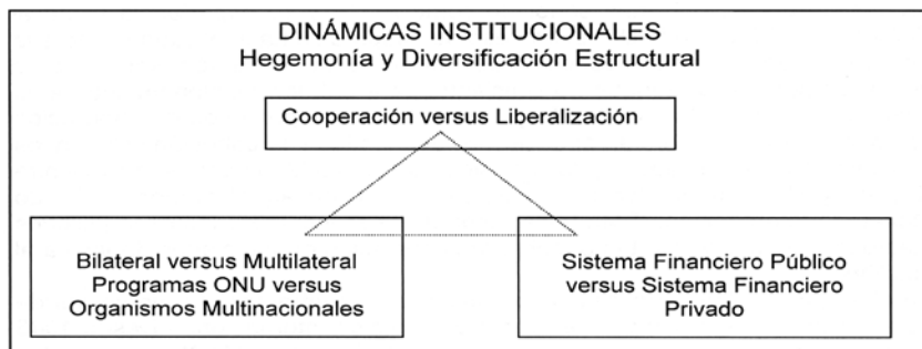
CUADRO 2: DINÁMICAS INSTITUCIONALES