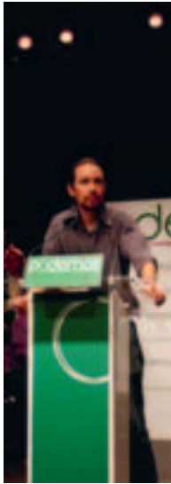
Offentlig præsentation af Podemos som politisk projekt med lederen Pablo Iglesias (16/01/2014).

Før Podemos blev oprettet, identificerede initiativtagerne 15M-bevægelsens store politiske potentiale samt nogle emner, som ville blive grundlaget for et nyt politisk parti på trods af et partisystem, som styrker de største partier. En ny måde at organisere sig på var nødvendig for at inddrage sociale bevægelser og muliggøre medlemmernes aktive deltagelse samt en ny diskurs, som appellerede til en transversal gruppe, som ikke var præget af en markant ideologi. Dette skulle kombineres med en kritik af 78-regimet og 'den gamle politik'. Disse karakteristika, som kommer fra en politisk refleksion over 15M-bevægelsen, fører til et første udkast til et politisk program, som bagefter skulle blive ændret, da muligheden for at tage magten blev mere sandsynlig.