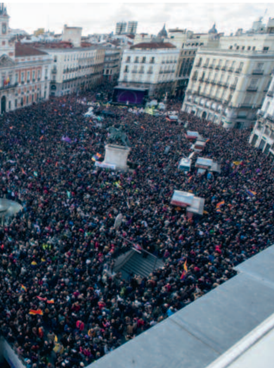
Ca. 200.000 mennesker deltog i March for forandring, Puerta del Sol, Madrid (31/01/2015).

af den populistiske diskurs, hvori oppositionen oppe/nede erstatter højre/venstre. Pablo Iglesias 26 afslører den strategiske dimension af det: "Når vi deler den spanske politik op i et felt, hvor der kun er rum for højre- og venstrefløjen, er det højrefløjen, der er mest begejstret for denne opdeling, fordi de ved, at hvis reglerne fungerer sådan, så har de