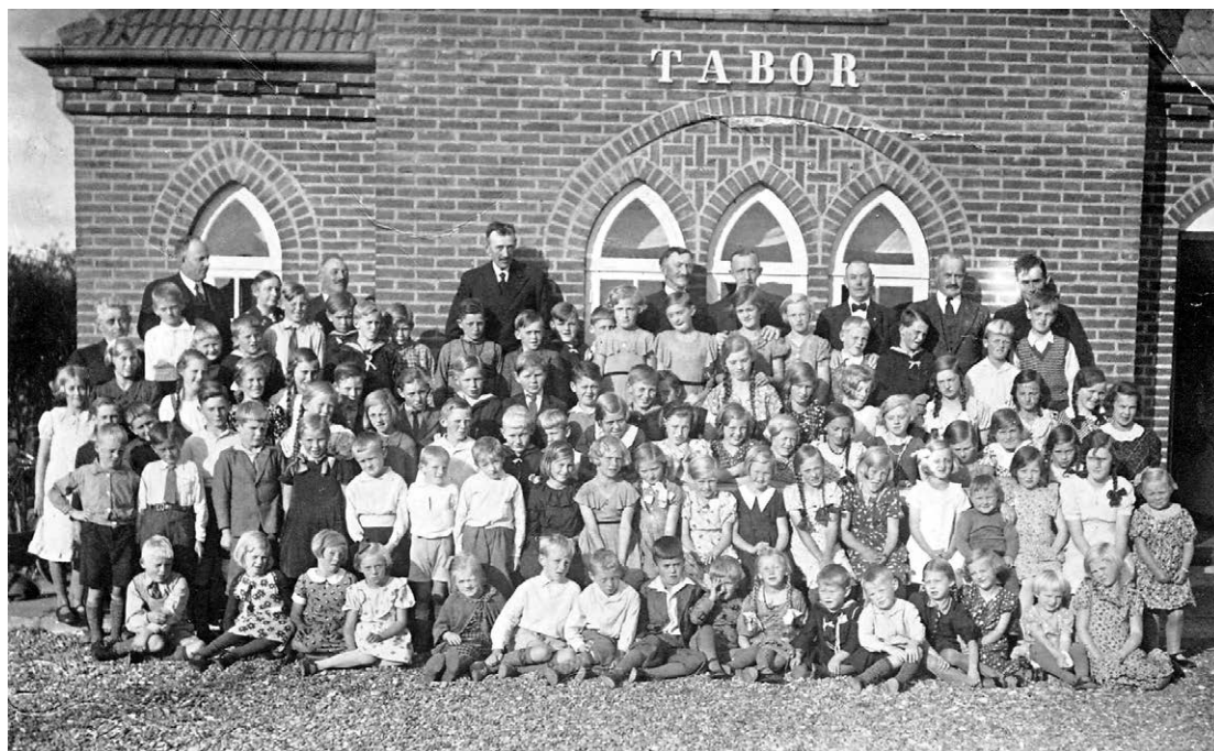
Søndagsskole i Tabor, ca. 1940.

Huset havde anderledes ejerskabsforhold end de fleste missionshuse, der som regel blev bygget for lokale midler, men derefter tilskødet Indre Missions landsorganisation. Tabor forblev derimod selvejende gennem hele sin eksistens – som missionshus. Det blev indviet den 20. maj 1924 og nedlagt på samme dato i 2009. Året efter blev Sundby missionshus solgt og et nyt kirkecenter ved Stagstrup kirke taget i brug som mødested for de to sognes Indre Missions samfund, der samtidig blev slået sammen. Landsorganisationen fik nu endelig ejendomsretten over Tabor , som vedligeholdes med pengene fra salget af »nabohuset« i Sundby. Samtidig fik Museum Thy overdraget »brugsretten« til huset, der om sommeren huser en lille udstilling om Indre Mission.