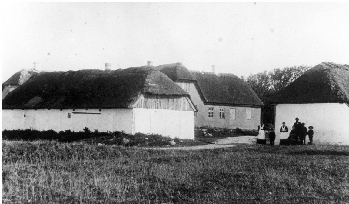
Rosholm præstegård, 1903.