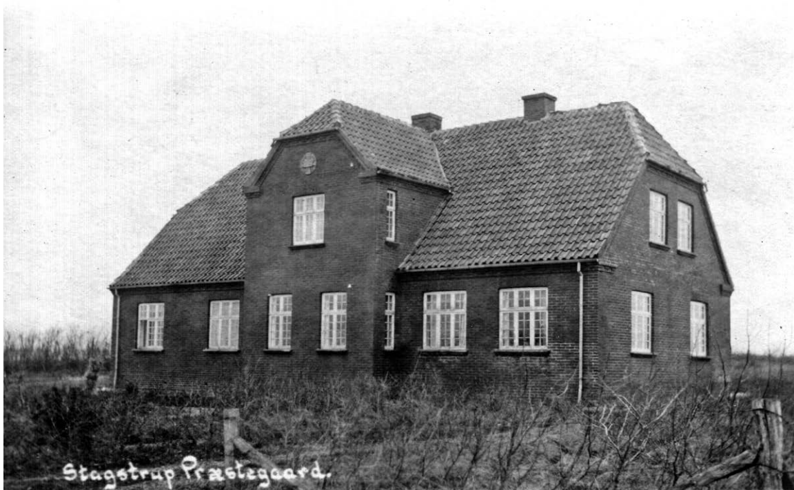
Stagstrup præstegård, opført 1920.