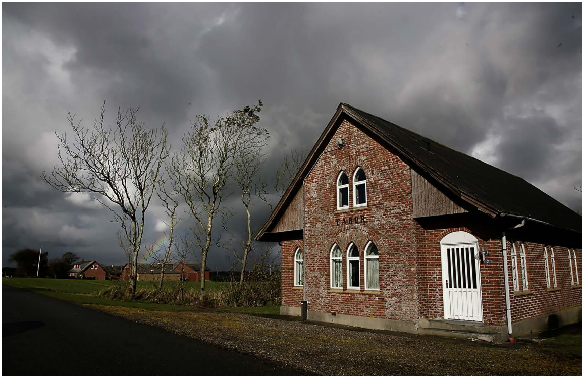
Missionshuset Tabor, 2011.

noget særligt ved det? Allerede på afstand springer de spidsbuede vinduer i øjnene og giver, trods husets ringe størrelse, mindelser om gotiske katedraler. Kommer man lidt tættere på, bemærker man straks navnet på facaden: TABOR. Den udenforstående beskuer vil nok ikke tænke nærmere over det; der er jo så mange navngivne huse rundt omkring. Den bibelkyndige læser vil genkende det som navnet på »Forklarelsens Bjerg« i Galilæa, hvor Jesus ifølge Matthæus-evangeliet