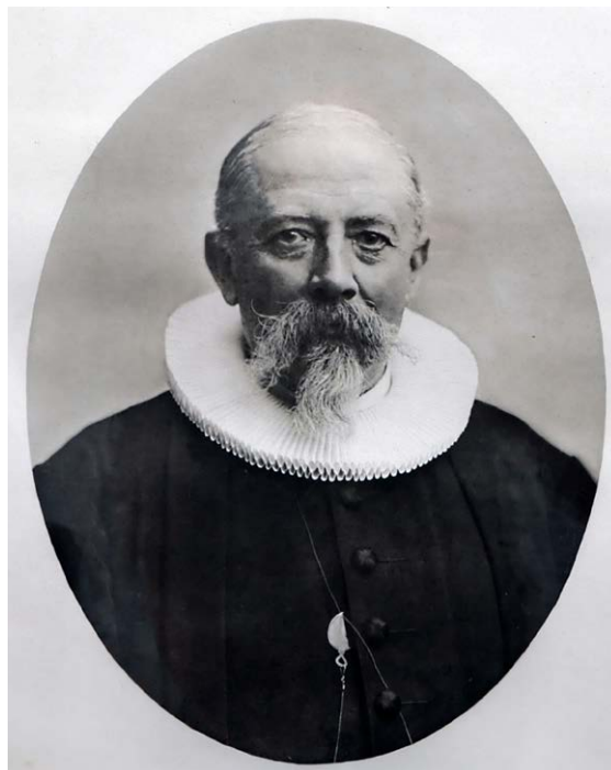
Vilhelm Beck, Indre Missions grundlægger og leder 1861-1901.

De såkaldt »gudelige vækkelser« havde deres udspring i starten af 1800-tallet, men fik for alvor vind i sejlene, da de blev lovliggjorte med indførelsen af den første frie forfatning og dermed religionsfrihed i 1849. Vækkelserne rummede både en kollektiv og en individuel dimension. På den ene side var de en del af de folkelige bevægelser, som, inspireret af internationale strømninger, skyllede hen over landet fra 1830'erne. Bevægelser, som både talte bønder, borgere og lidt senere også arbejdere og kvinder, og som i høj grad var med til at forme det nye demokratiske Danmark og gøre op med enevældens ekstremt topstyrede samfund. På det religiøse område gjaldt opgøret ikke mindst præstevældet. Man opfattede kirkelivet som kedeligt og stillestående og for præget af konservative, reaktionære teologer. Man ønskede