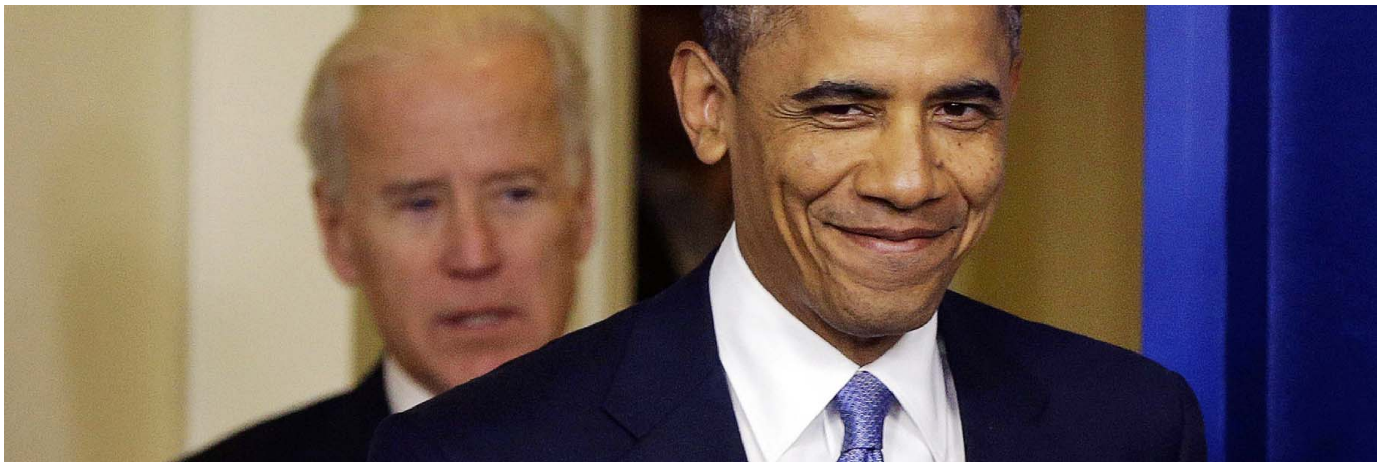
BUDGETSMIL. Det lykkedes tidligere i denne uge for USA's præsident, Barack Obama, at lande den meget omtalte budgetaftale, som vil give en række skattestigninger til de rigeste amerikanere. Her ses han med vicepræsident Joe Biden.