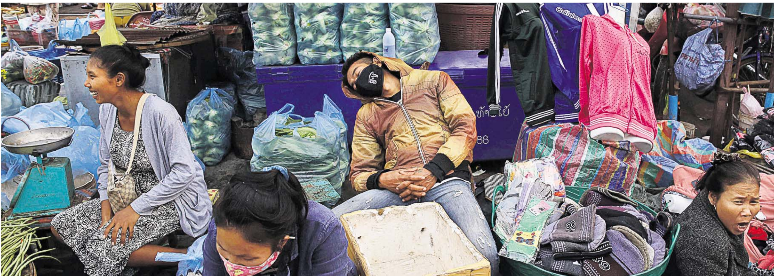
GADEHANDLERE. Mens uligheden er steget støt og meget i blandt andet de nordiske lande gennem de seneste 20 år, er der andre steder på kloden, hvor man enten har stoppet eller bremset væksten i ulighed. Her er vi på gaden i Laos.