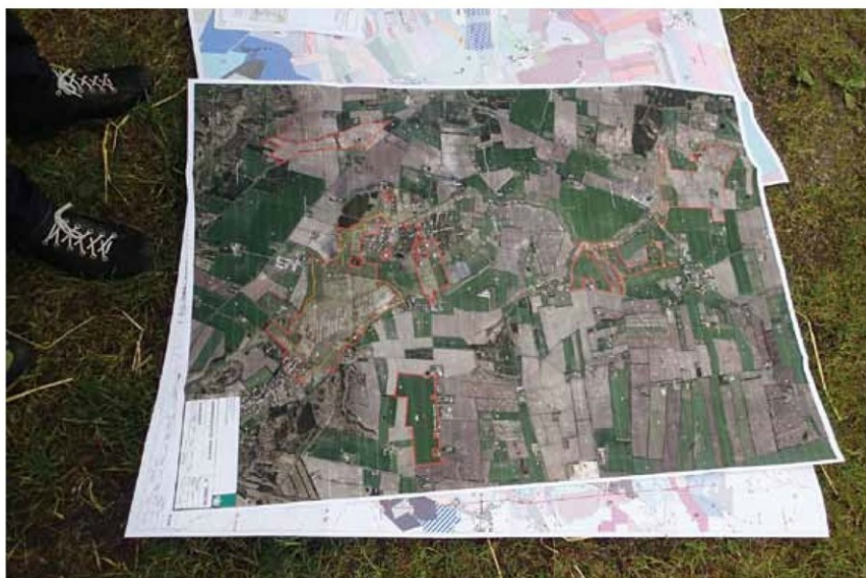
Genskabelsen af Hjeds Sø i Vesthimmerlands Kommune er besluttet som et projekt til forbedring af vandmiljøet og lodsejerforhandlingerne er gået i gang.