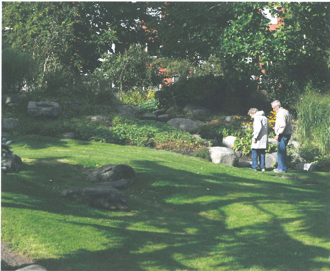
Inför domarnas besök beslutade Aalborg Kommune för att renovera perennplanteringen i Østre Anlæg.