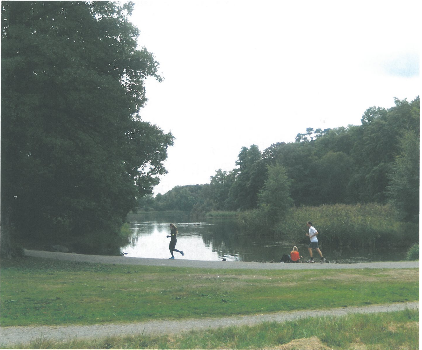
Hagaparken är naturskönt belägen i Solna med utsikt över Brunnsviken.

visioner för Frognerparken och konstaterar dessutom att dessa är bra förmedlade via kommunens hemsida.