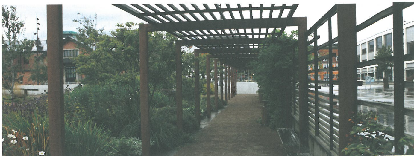
Jomfru Anneparken i Aalborg spelar en viktig roll i förnyelsen av hamnområdet i Aalborg. Utöver Green Space Award har hamnfronten belönats med Vejprisen 2011.