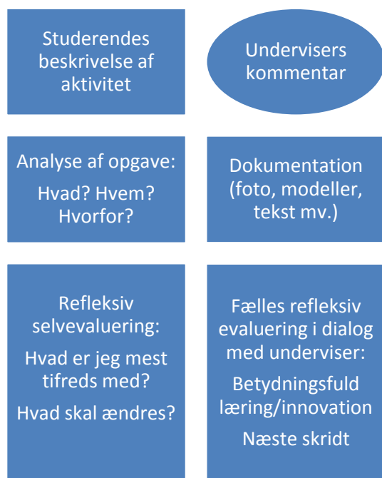
Figur 1: Åben evaluering, eksempel på evalueringsark (inspiration fra Ellis & Barrs, 2008)