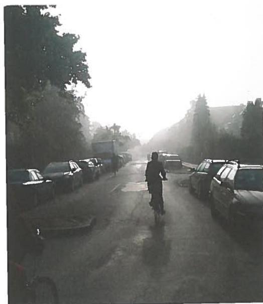
De fleste cyklister vil helst bare køre lige ud. Skal de svinge, vil de hellere svinge til højre end til venstre.

Ud over at give nyttig information om cyklisters rutevalg og præferencer i sig selv, lægger vores resultater op til (i hvert fald) tre anvendelsesområder: