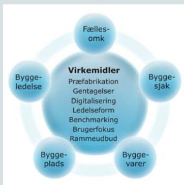
Figur 1: Model for forbedring af produktivitet

Det i Figur 1 viste princip for forbedring af produktivitet har: