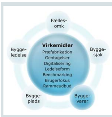
Figur 7: Byggevareindkøb og materialelogistik

Indsatsområdet 'Byggevareindkøb og materialelogistik' ('byggevarer') omfatter bestilling og indkøb af materialer, byggevarer, byggesystemer og lignende der indbygges i bygningen.