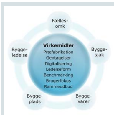
Figur 2: Virkemidler til produktivitetsudvikling af bygningsdele