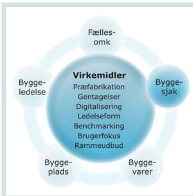
Figur 5: Byggesjakkene, udførelse og tidsstyring på pladsen

Indsatsområdet 'Byggesjakkene, udførelse og tidsstyring på pladsen' (i det efterfølgende kaldes det kun 'byggesjakkene') omfatter alle omkostninger og aktiviteter i de forskellige fag- og tværfaglige sjak, som udfører renoveringer og fornyelser.