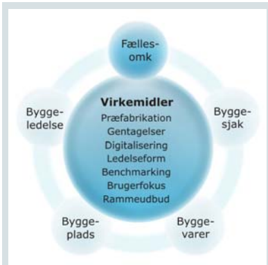
Figur 3: Virkemiddel – Fælles- omkostninger