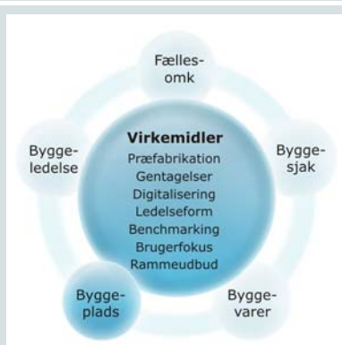
Figur 6: Byggepladsen, skure, platforme og andet materiel

Indsatsområdet 'Byggepladsen, skure, platforme og andet materiel' (i det efterfølgende kaldes det kun 'byggepladsen') omfatter alle omkostninger og aktiviteter som driver den fysiske byggeplads og alle hjælpefunktioner som understøtter plan- og renoveringsarbejdet på bebyggelsen. Indsatsen har sin hovedvægt i udførelsesfasen og i mindre omfang i projekterings- og programfasen, hvor omkostningerne derfor ikke er så store.