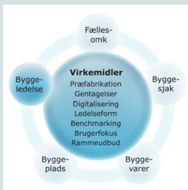
Figur 4: Byggeledelse og dækningsbidrag for entreprenører

Indsatsområdet 'Byggeledelse og dækningsbidrag for entreprenører' (i det efterfølgende kaldes det kun 'byggeledelse') omfatter alle omkostninger og aktiviteter vedrørende total-, hoved- og fagentreprenørernes omkostninger ved byggeledelse af sagen samt entreprenørernes dækningsbidrag.