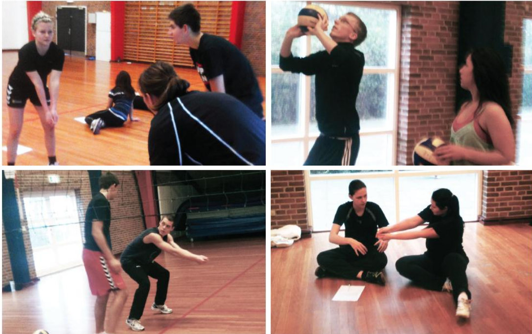
Eksempler på makker-feedback . Både krop og sprog anvendes når der formidles.

Forløbet varede fire lektionsgange i forbindelse med volleyballundervisningen på en dansk idrætshøjskole i Vendsyssel, Nordjylland. Eleverne skulle igennem de fire lektioner arbejde med makker-feedback, som de blev introduceret til i den første lektionsgang. Hver elev fik tildelt en makker og en logbog. Logbogen skulle bruges som en refleksionsbog og som hjælpeguide. Igennem forløbet blev undervisningen observeret. Underviseren var instrueret i, at hun ikke selv skulle give direkte feedback til eleverne.