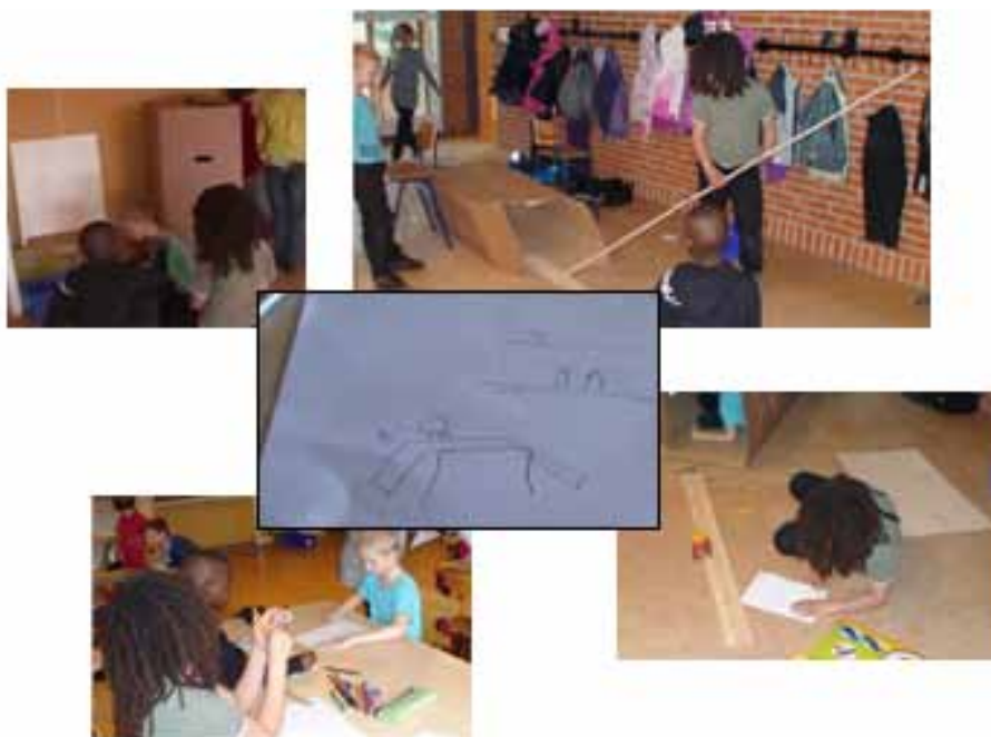
Figur 2. Første klasses elever i færd med at opstille og afprøve hypoteser. Hypotesen – at få biler til selv at kører ned fra kassen – er gengivet som det centrale billede. Skovsgård skole, april 2011.